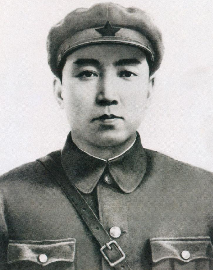
Ким Ир Сен