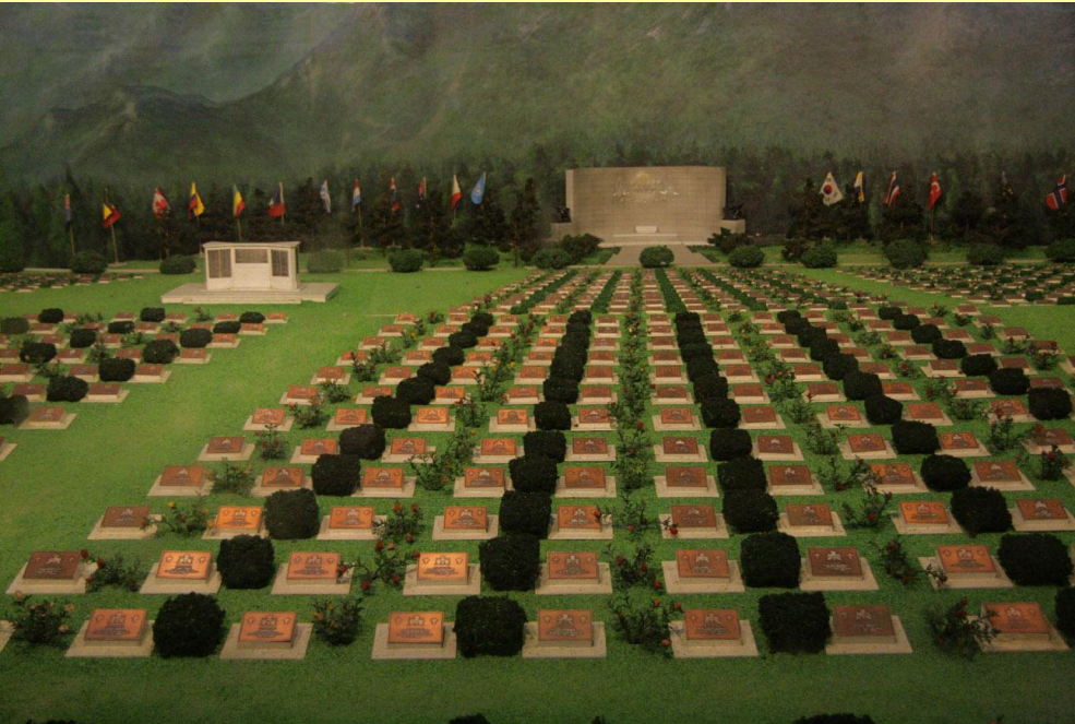
Мемориал павшим в Корейской войне.

Война в Корее оказалась самой кровопролитной в истории человечества после Второй Мировой. Погибли 9 млн. корейцев, 1 млн. китайцев. Силы ООН потеряли 118 тыс. убитыми (в т.ч. 54 тыс. американцев), 265 тыс. ранеными и 93 тыс. пленными.