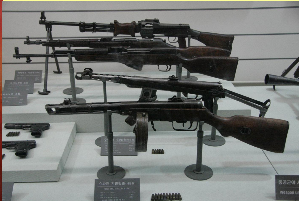
Трофейное оружие советского производства, захваченное у китайских войск в Корее.