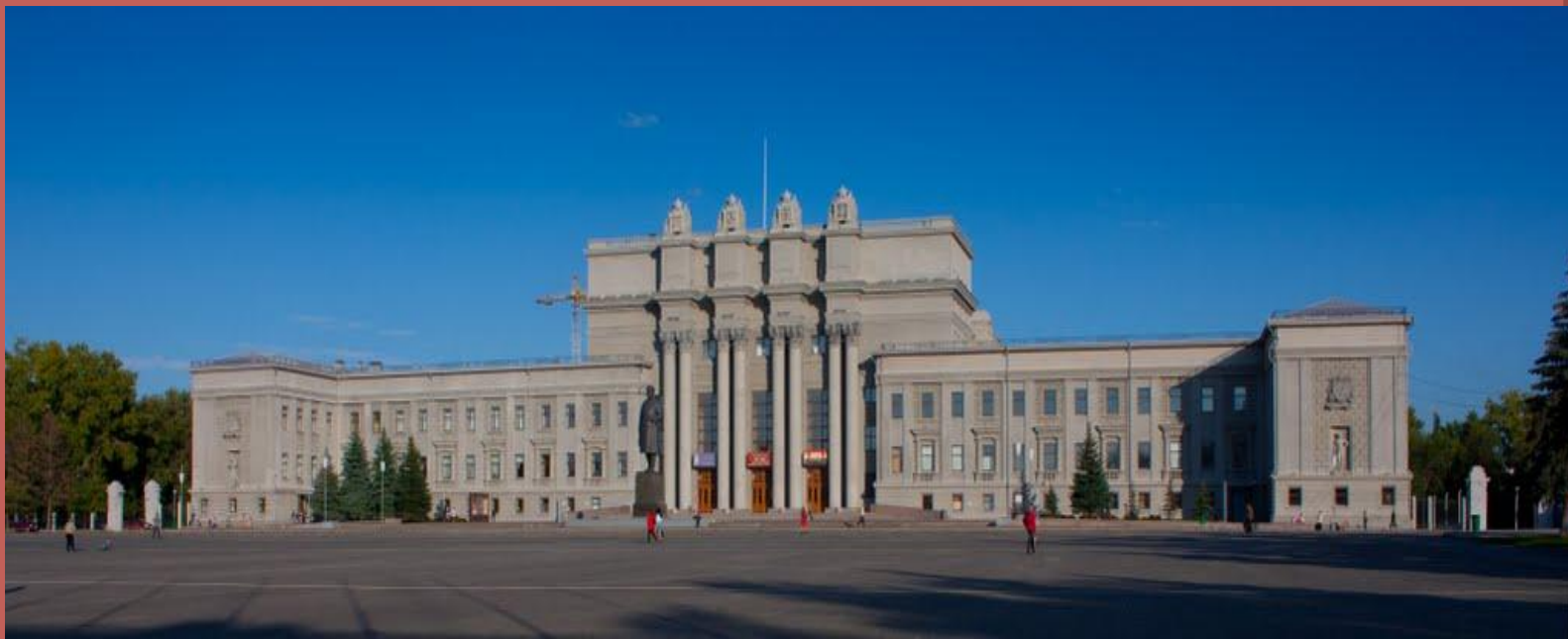
Самарский академический театр опера и балета