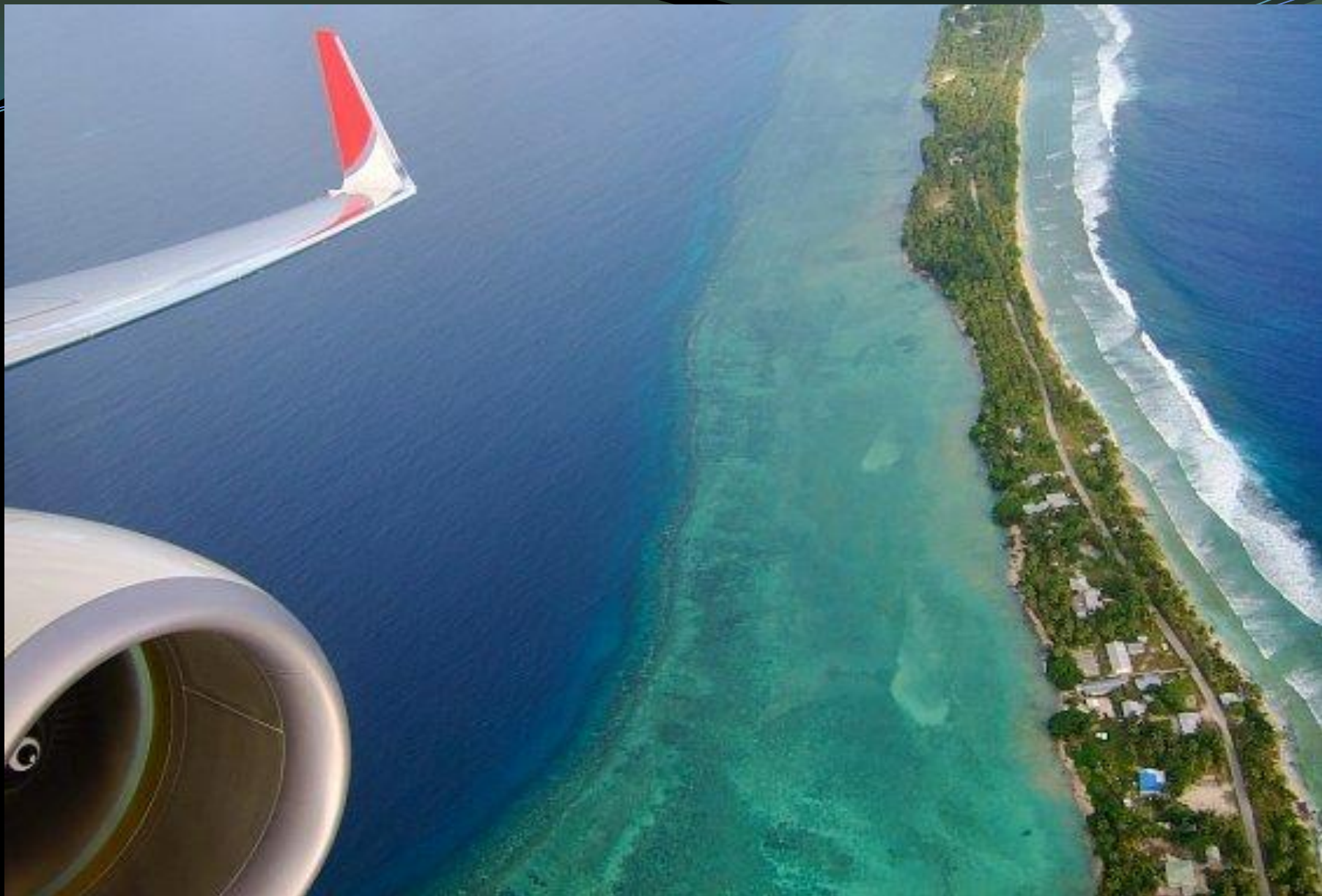
Маршалл Аралдарына аспаннан көрініс