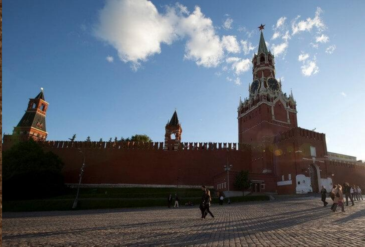
Московский Кремль и Красная площадь.

Кремль — не просто удивительное историческое сооружение, но и символ российской власти. Рассказывать обо всем, что можно увидеть на просторах Красной площади и Кремля можно очень долго, этот объект до сих пор остается предметом изучения ученых и создает все новые легенды. Разумеется, побывать в России и не посетить ее сердце, будет огромным упущением!