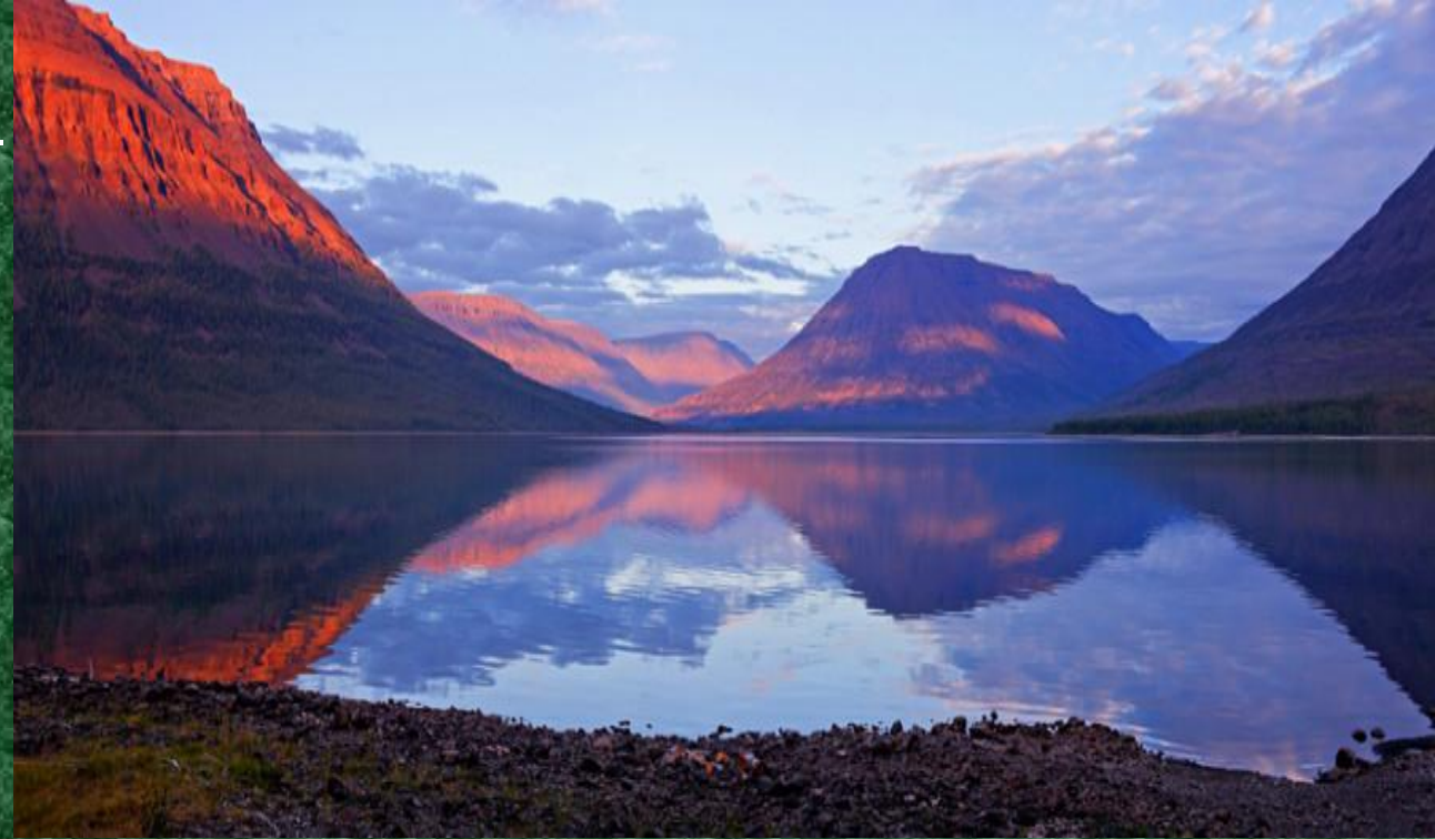
Плато Путорана, Красноярский край.

Площадь плато составляет 250 тыс. кв. км, что сравнимо с территорией Великобритании. На территории плато расположен Путоранский государственный природный заповедник, признанный ЮНЕСКО памятником Всемирного наследия человечества.