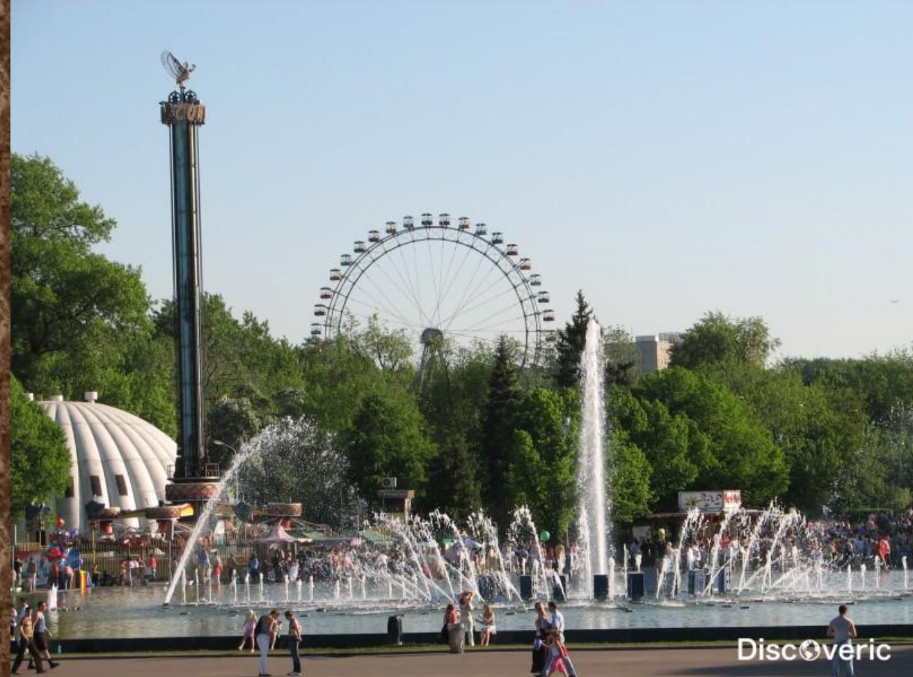
Парк культуры и отдыха имени Горького.

Открытый еще в 1928 году на территории свыше 100 га, парк хорош в любое время года. Даже зимой, когда аттракционы закрываются, это место притягивает огромное количество посетителей, - под открытым небом заливается крупнейший во всей столице каток. Здесь можно найти развлечения на любой вкус – отдохнуть одному, с друзьями, с семьей, покатавшись на самых невероятных и экстремальных аттракционах Москвы. Выброс адреналина вам гарантирован, вы вполне сможете отвлечься от проблем, смеяться, визжать, орать и абсолютно не контролировать свои эмоции.