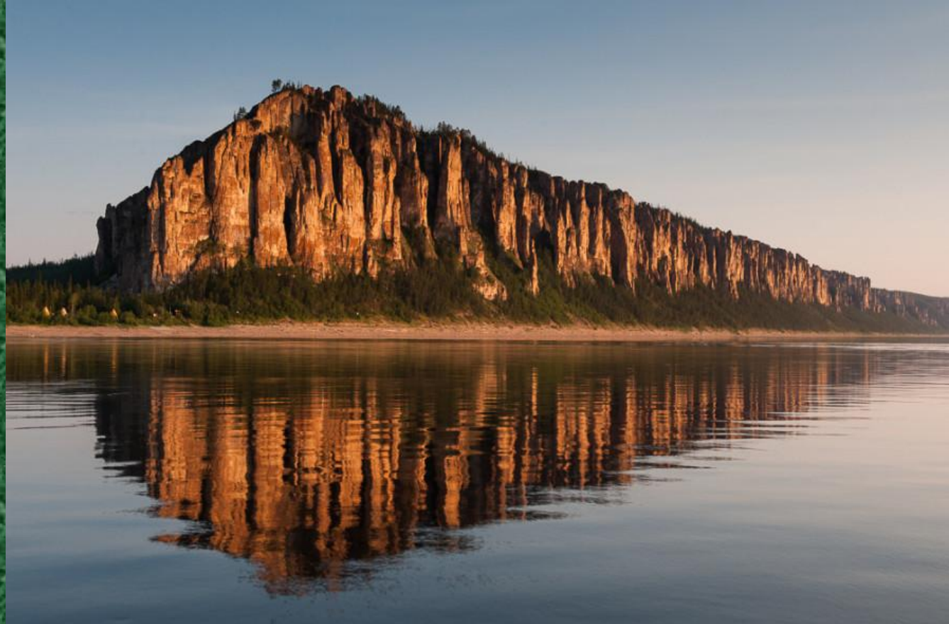
Ленские столбы, Якутия.

На географической карте мира точное местонахождение можно вычислить по следующим координатам: 61^{\circ} 7' 45.48'' с. ш., 127^{\circ} 31' 4.8'' в. д.).