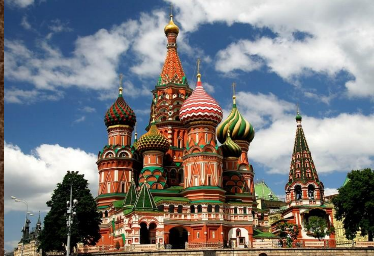
Храм Василия Блаженного.

На том месте, где сейчас красуется собор, в XVI веке стояла каменная Троицкая церковь, «что на Рву».