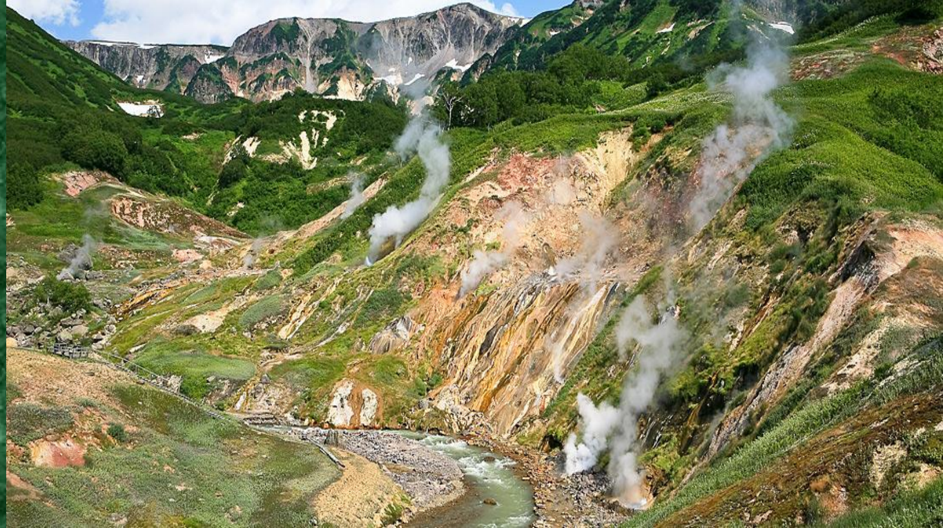
Долина Гейзеров , Камчатка .

Включена в список Всемирного природного наследия ЮНЕСКО.