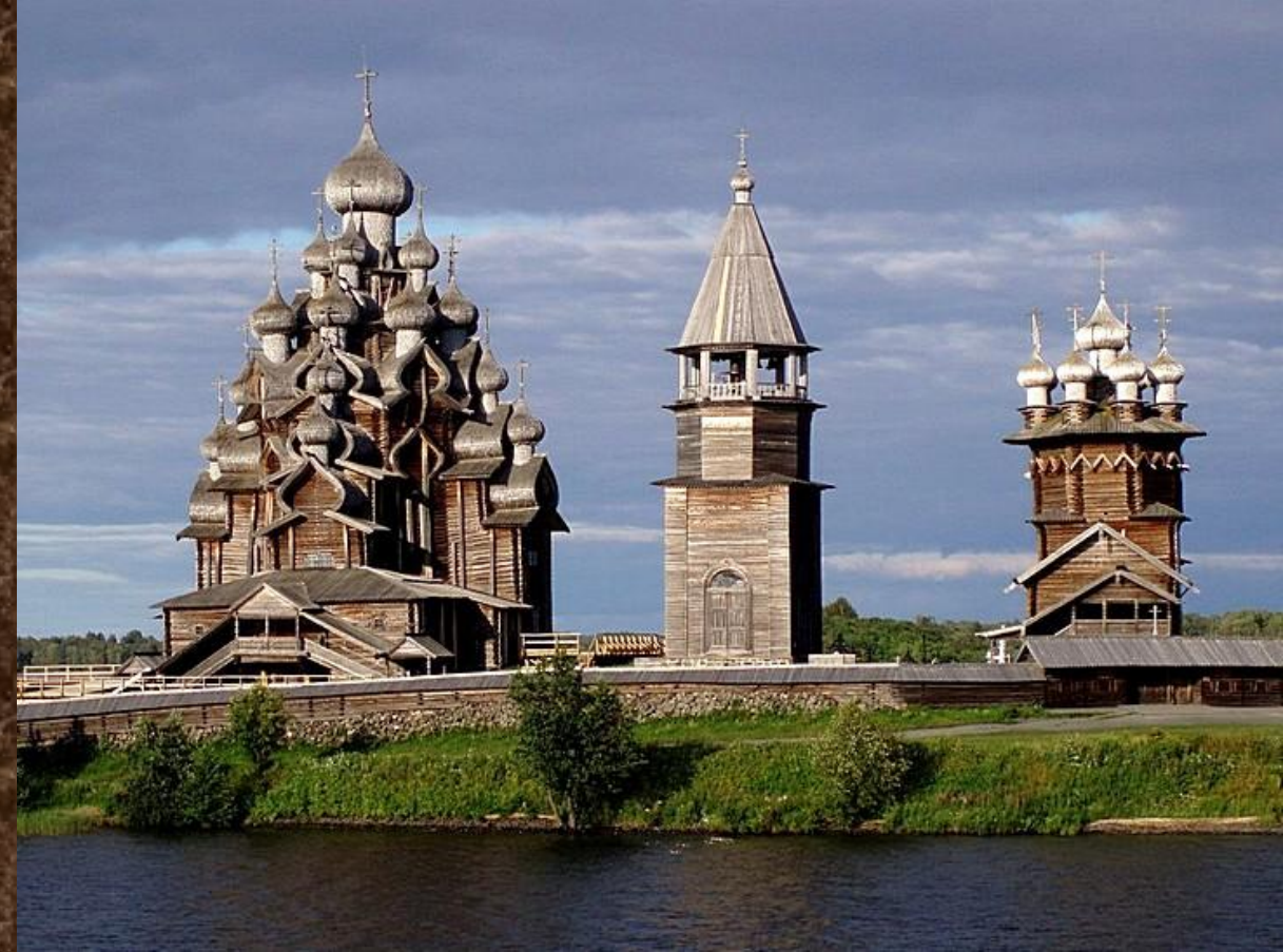
Архитектурный ансамбль Кижского.

Этот архитектурный ансамбль, который состоит из колокольни и двух церквей является главной достопримечательностью острова и музея.