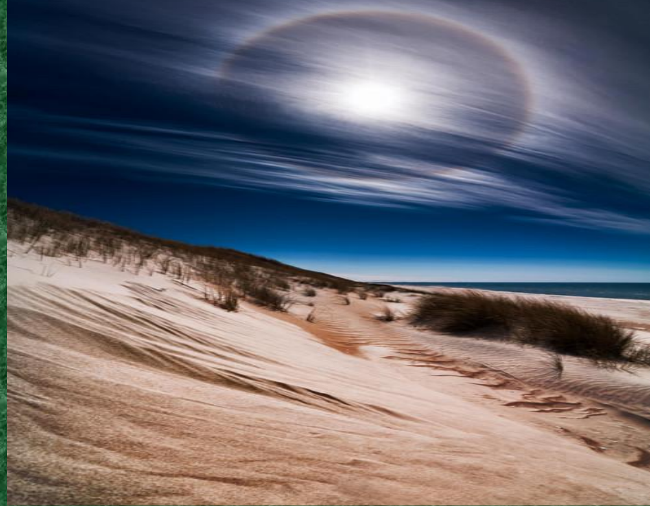
Куршская коса, Калининградская область.

Длина — 98 километров, ширина колеблется от 400 метров (в районе посёлка Лесной) до 3,8 километров (в районе мыса Бульвикё, чуть севернее Ниды).