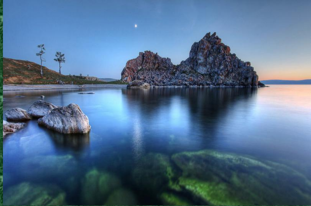
Озеро Байкал, Восточная Сибирь.

Значение максимальной глубины озера — 1642 м — было установлено в 1983 году Л. Г. Колотило и А. И. Сулимовым во время выполнения гидрографических работ. Средняя глубина озера также очень велика — 744,4 м. Кроме Байкала на Земле только два озера имеют глубину более 1000 метров: Танганьика (1470 м) и Каспийское море (1025 м). Одна из визитных карточек России, место, которое нужно увидеть своими глазами хотя бы раз в жизни!