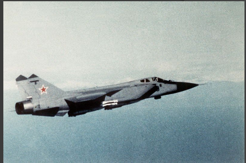
МиГ-31 — тяжёлый скоростной перехватчик