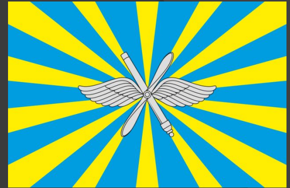
Флаг ВВС России