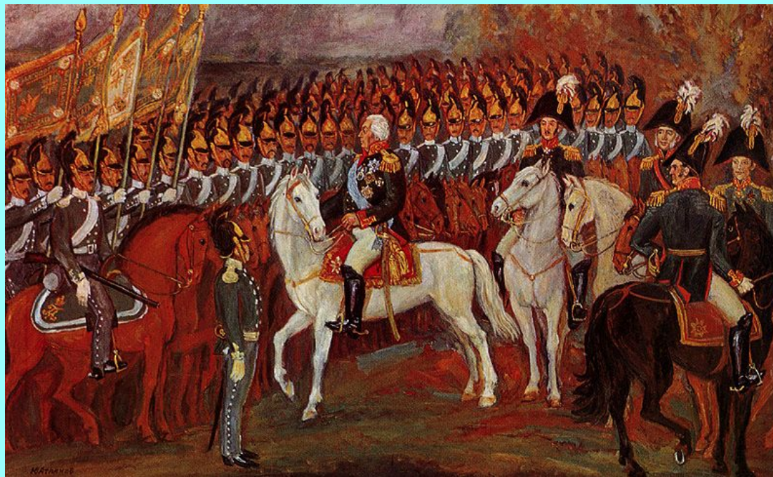
Обращение М. И. Кутузова к войскам накануне Бородинского сражения. Художник Ю. Атланов. 1982 г.

Русский народ справедливо гордится боевой доблестью своих сынов, проявленной в Бородинском сражении. Это сражение произошло во время Отечественной войны 7 сентября (26 августа по старому стилю) 1812 г. на Бородинском поле в 12 километрах западнее города Можайска, в 110 километрах от Москвы.