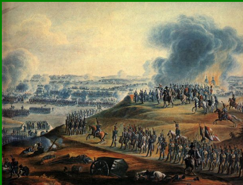
Бородинское сражение 26 августа 1812 г. Акварель неизвестного художника.