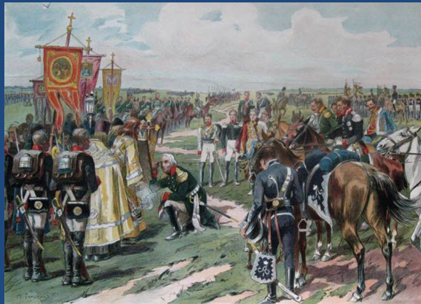
Н.С.Самокиш. Кутузов объезжает войска 25 августа 1812 года