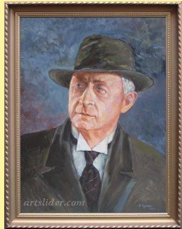
Фотография портрета Нобелевского лауреата. И. Бунин.