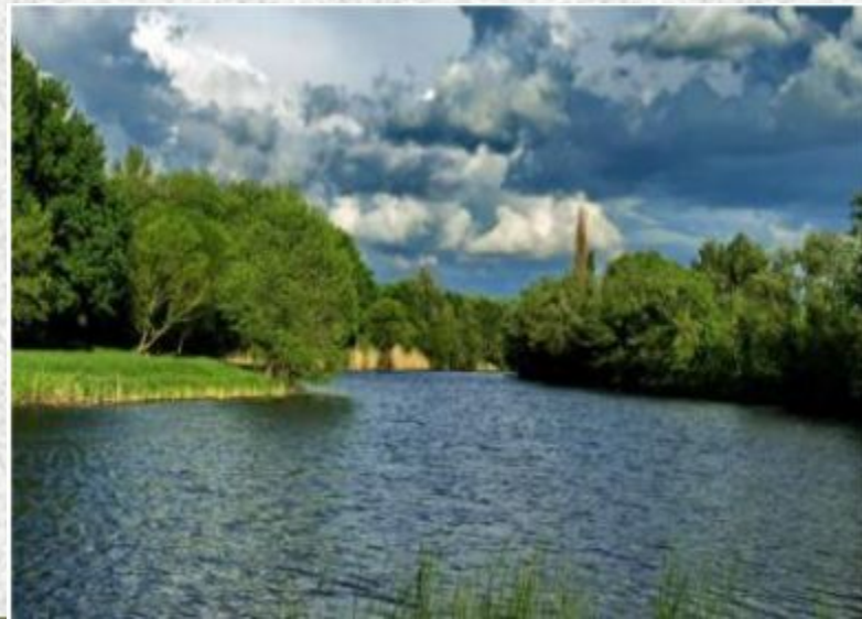
река Казенный Торец

Основную часть запасов поверхностных вод нашего края составляют реки. По территории нашего края протекают 247 рек, 47 из которых имеют протяжённость более 25 км каждая, и более 2000 пересыхающих или временно пересыхающих водотоков. Балки служат руслом для небольших речек, образующихся в период таяния снега и обильных осадков (балка Скелевая, Бирючья, Сухая, Широкая и др.). Реки Донецкого края, главным образом, средние и малые. Средний коэффициент густоты речной сети по Донецкому краю составляет 0,5 \text{ км/км}^2 .