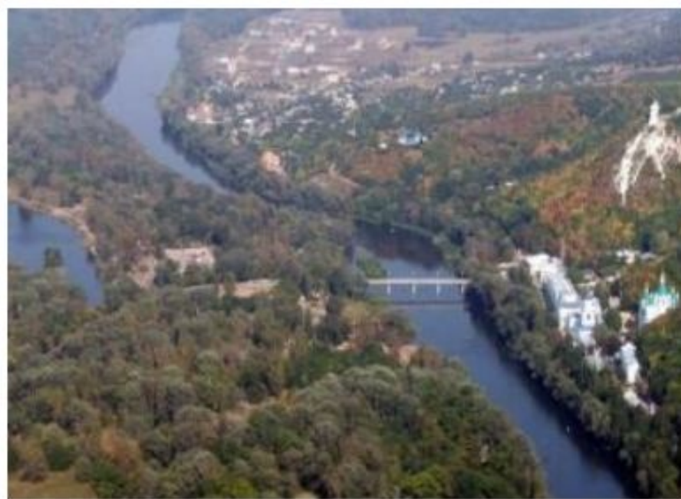
река Северский Донец

Вода – хорошо знакомая каждому из нас бесцветная жидкость без вкуса и запаха. В то же время вода – наиболее ценный минерал на Земле. На Земле выражение «Есть вода – значит, есть жизнь» действует как важнейший закон природы. Не удивительно, что люди издавна селились по берегам водоёмов, используя их воду для разных целей.