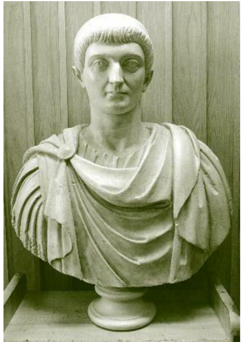
Бюст императора Константина I