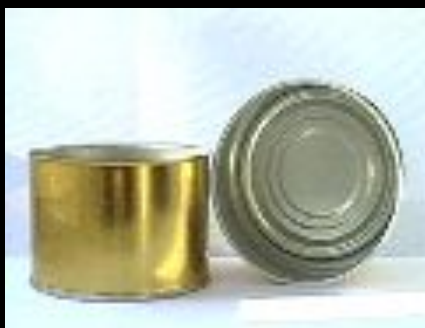
Разложение консервной банки – 90 лет