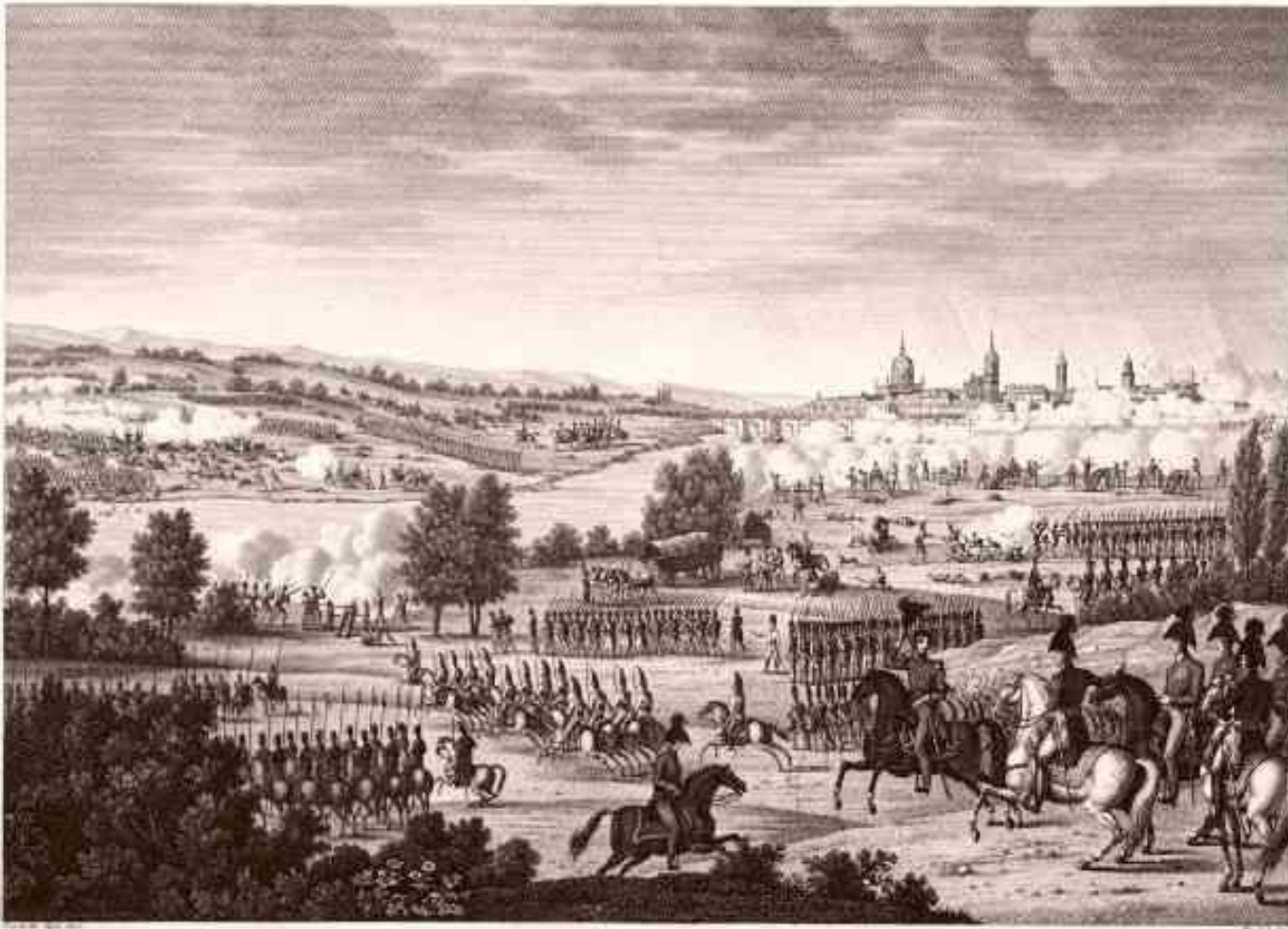
BATAILLE DE DRESDE, LIVRÉE LE 26 AOÛT 1813.