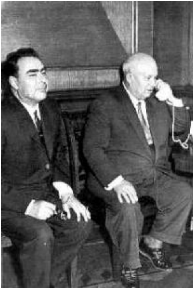
Л.Брежнев и Н.Хрущев на сеансе связи с космонавтами.

Непоследовательность Н. Хрущева, частые перетряски в аппарате, его нежелание прислушиваться к мнению других членов высшего руководства привели к складыванию против него заговора части партийного и государственного аппарата. В октябре 1964г. Н. Хрущев был отправлен на пенсию.