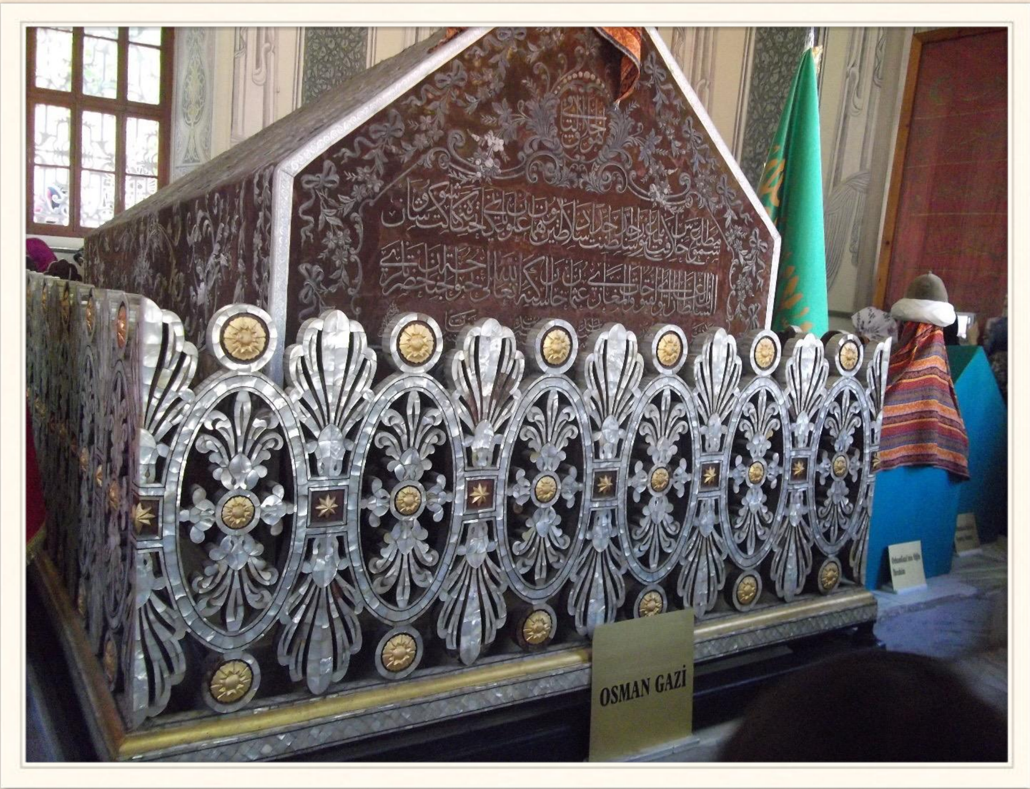
Гробниця Османа Газі