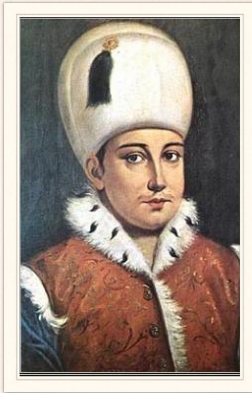
Осман I Газі у юному віці