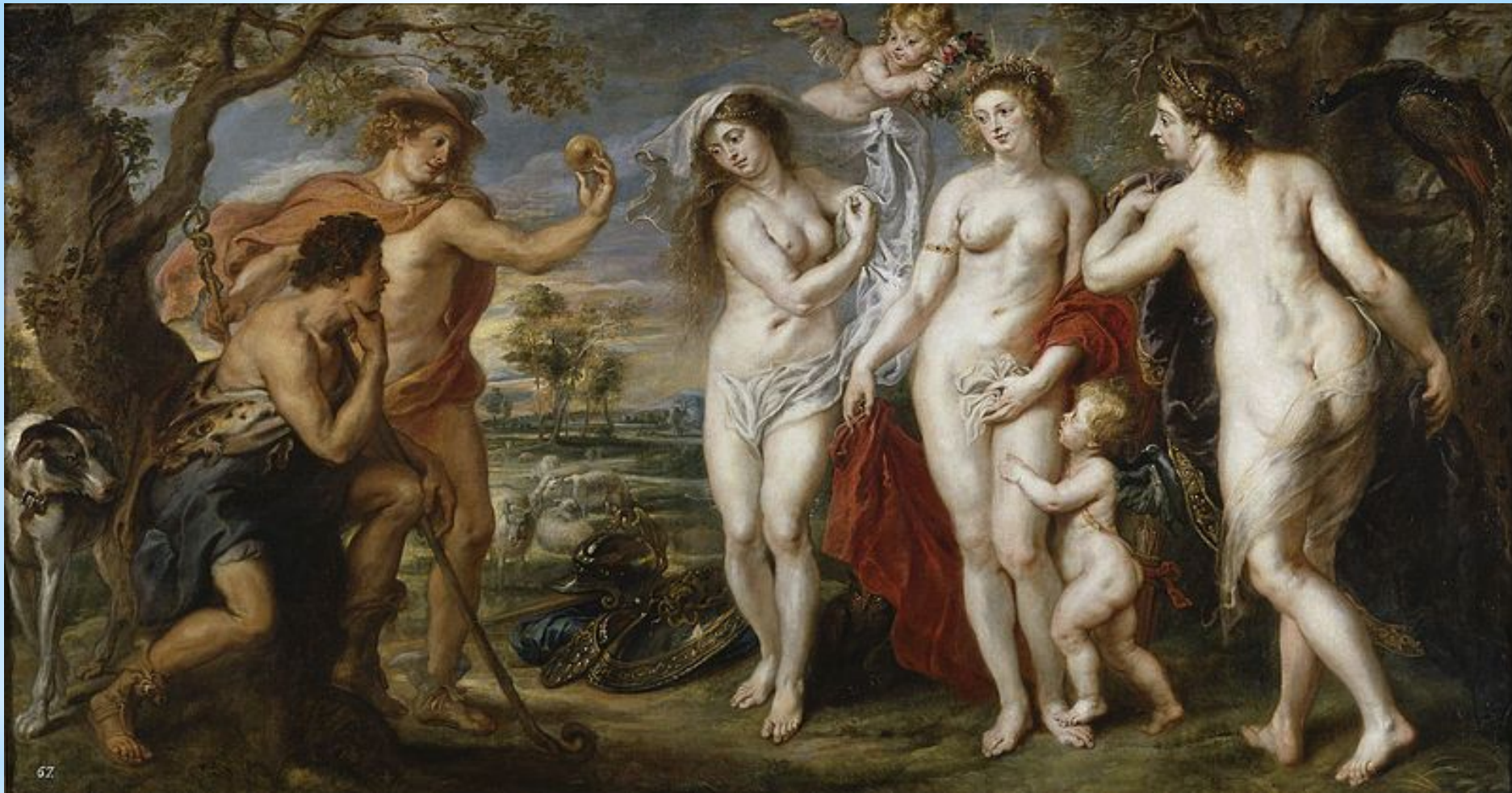
Питер Пауль Рубенс. Суд Париса 1638 - 1639