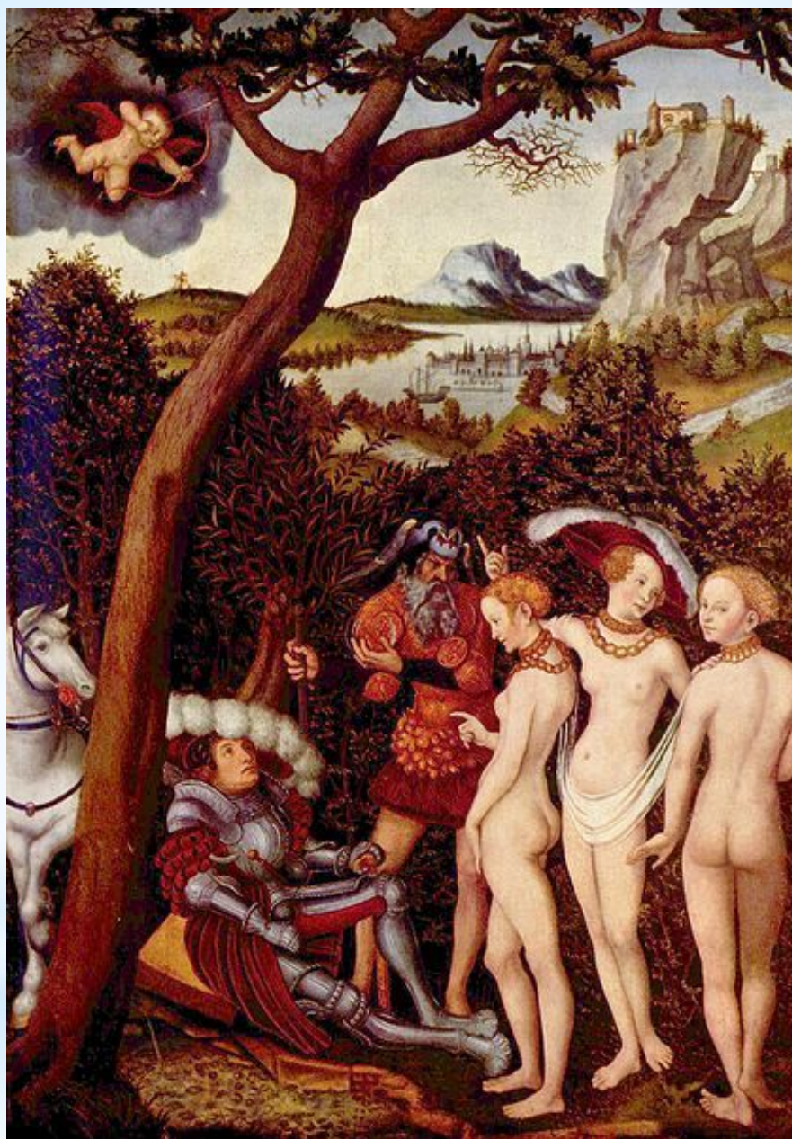
«Суд Париса», Лукас Кранах Старший , ок. 1528, музей Метрополитен , Нью-Йорк