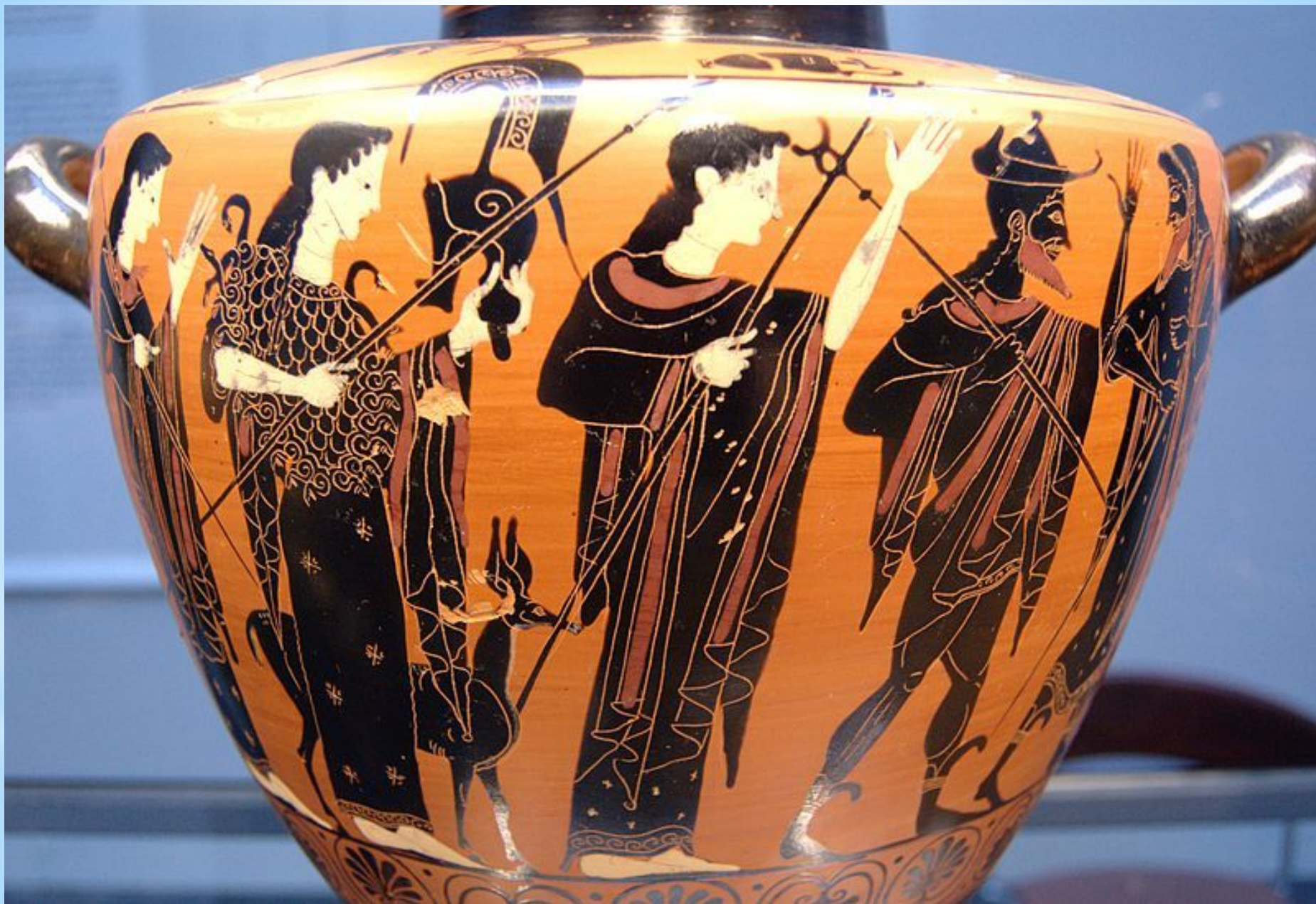
«Суд Париса». Ок. 510 до н. э. Чернофигурная аттическая гидрия. Государственное античное собрание. Мюнхен