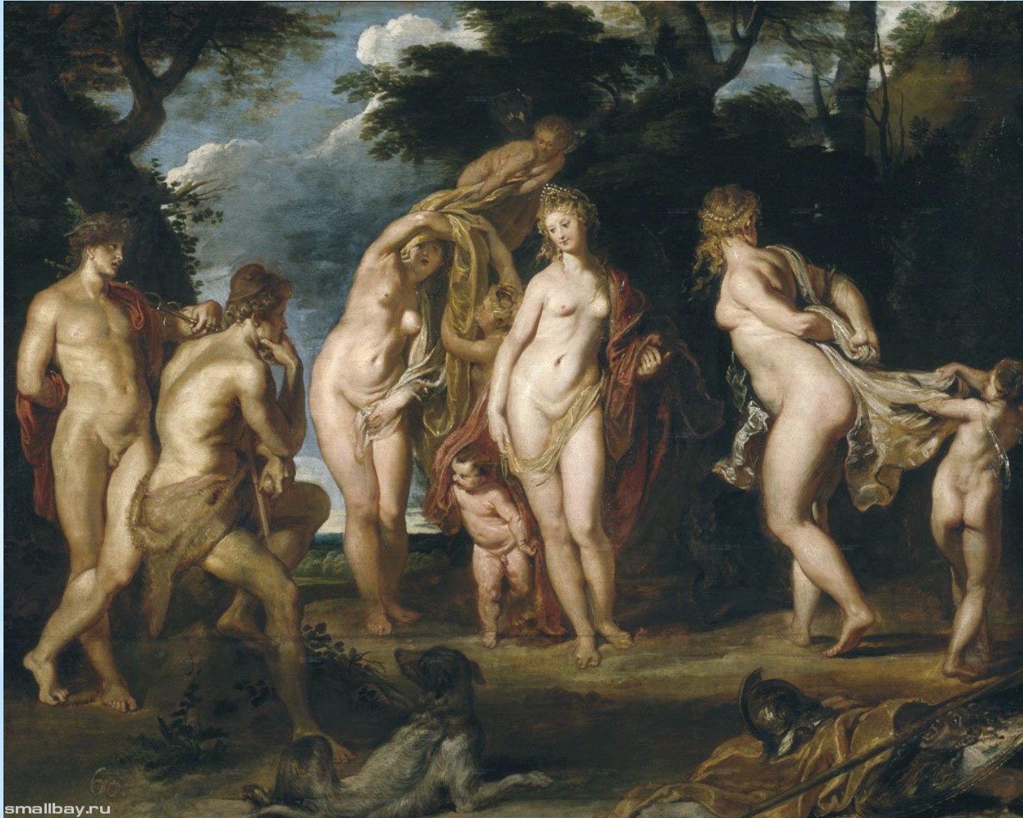
Питер Пауль рубенс. Суд Париса. 1605. Музей Прадо, Мадрид.