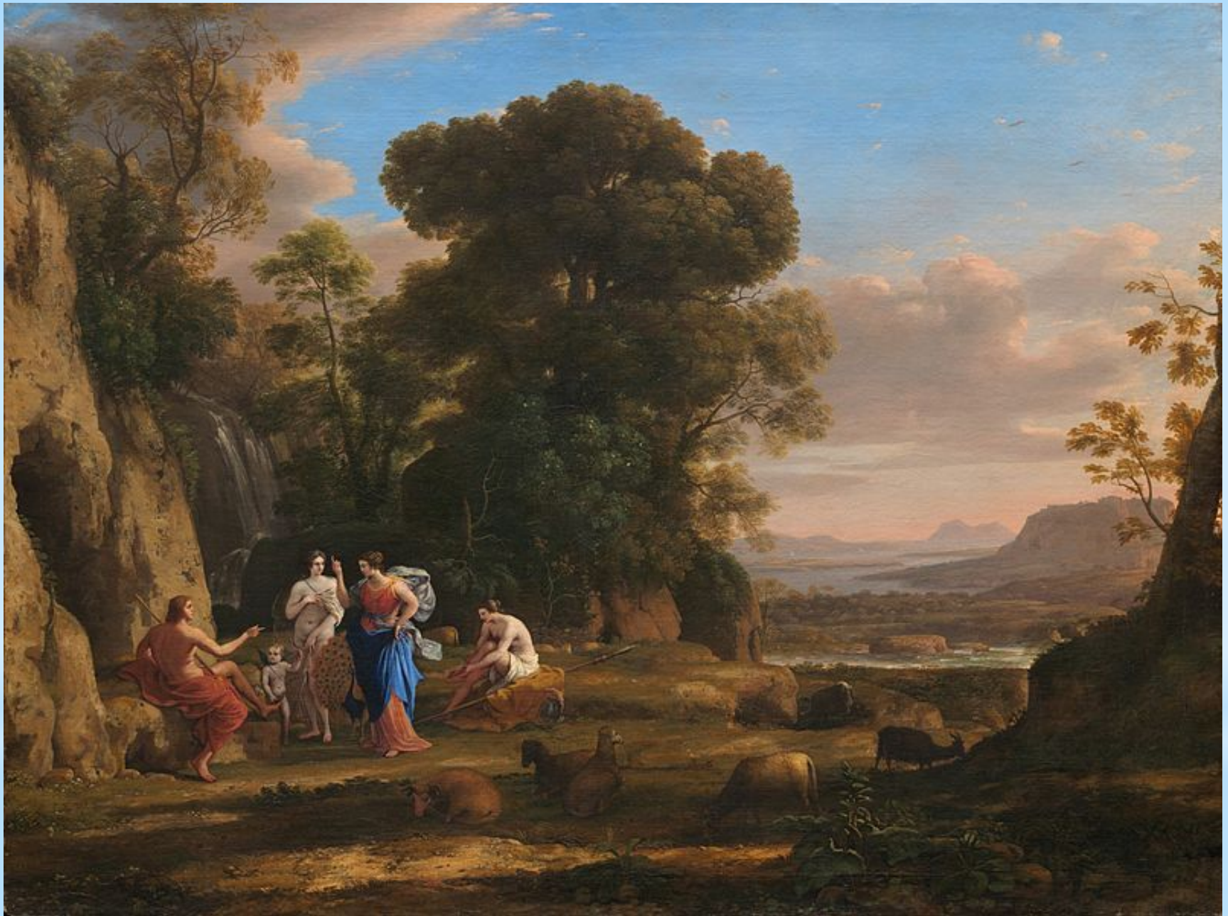
Суд Париса. Клод Лоррен. 1645 - 1646