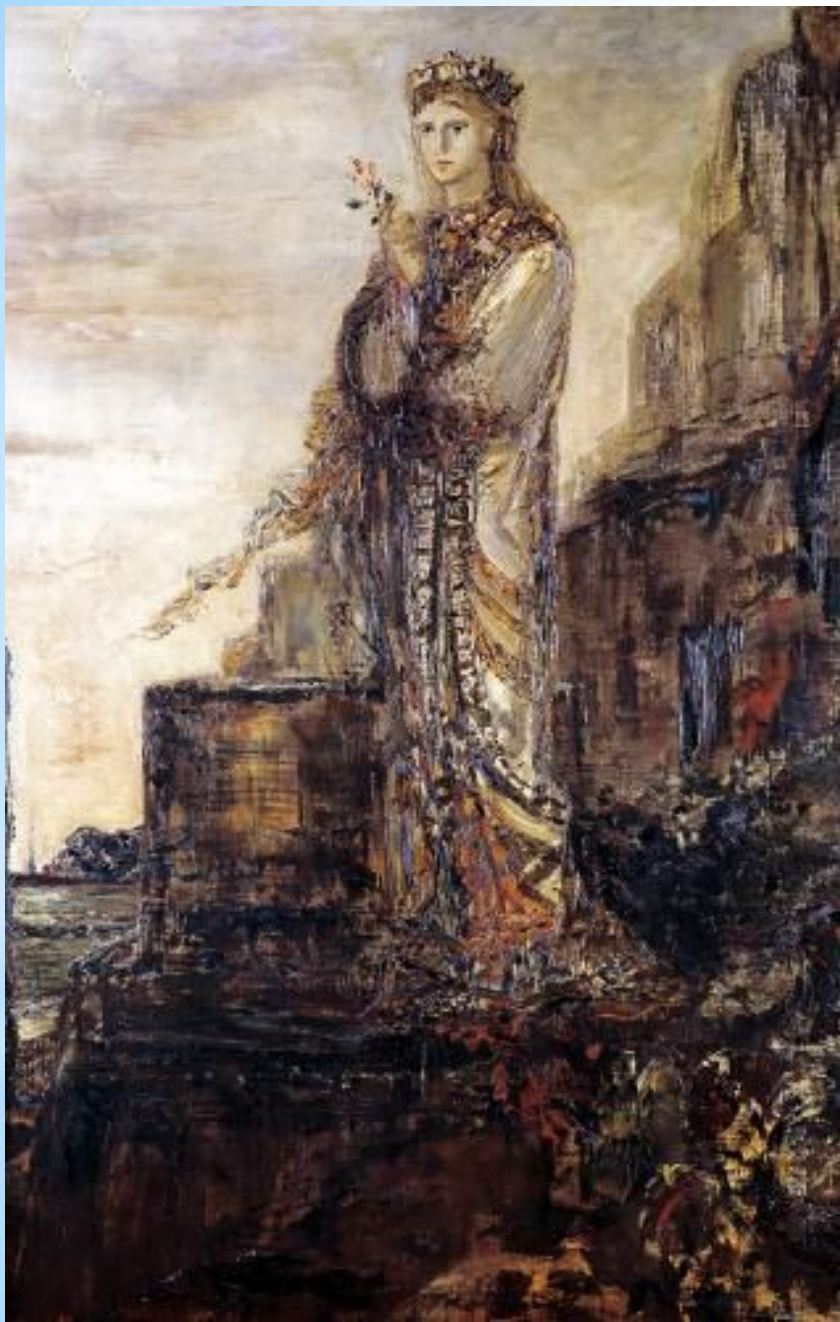
Гюстав Моро - Елена Троянская