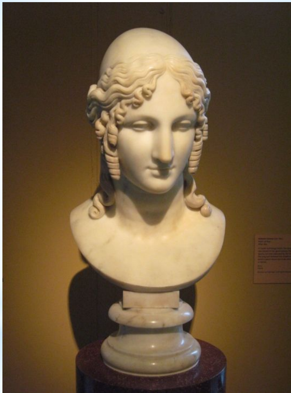
Антонио Канова. Елена Троянская