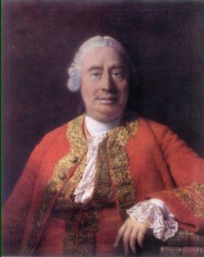
Дэвид Юм (1711-1776)