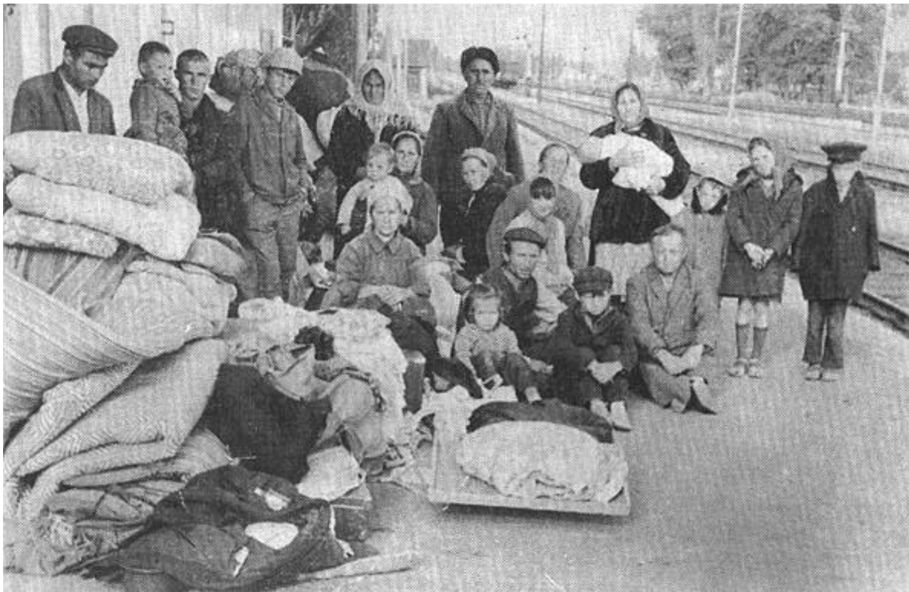
В ожидании депортации. Крымские татары.