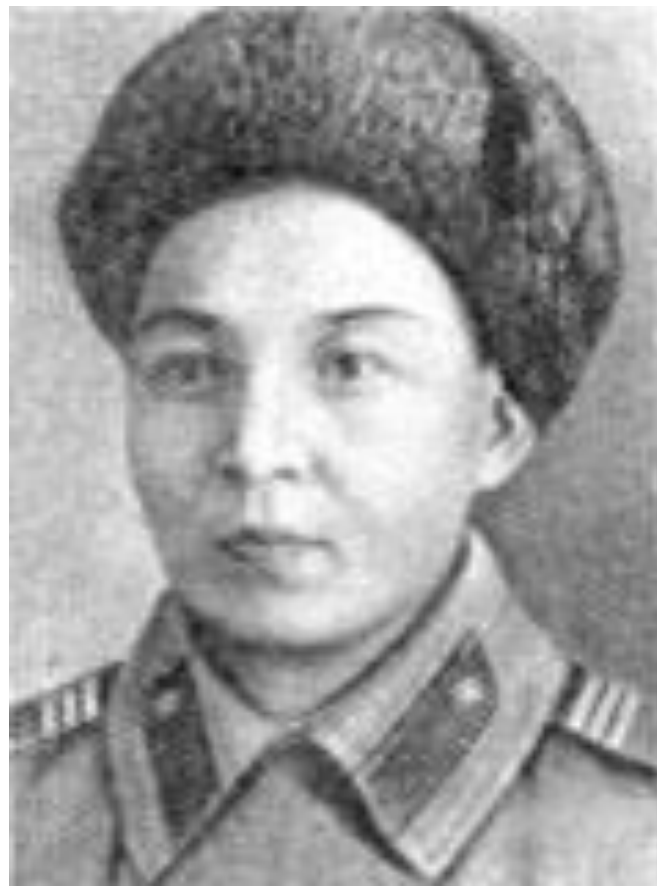
Мамётова Маншук пулемётчица 21-й гвардейской стрелковой дивизии 3-й ударной армии Калининского фронта, гвардии старший сержант. Первая казахская женщина, которой было присвоено звание Герой Советского Союза.