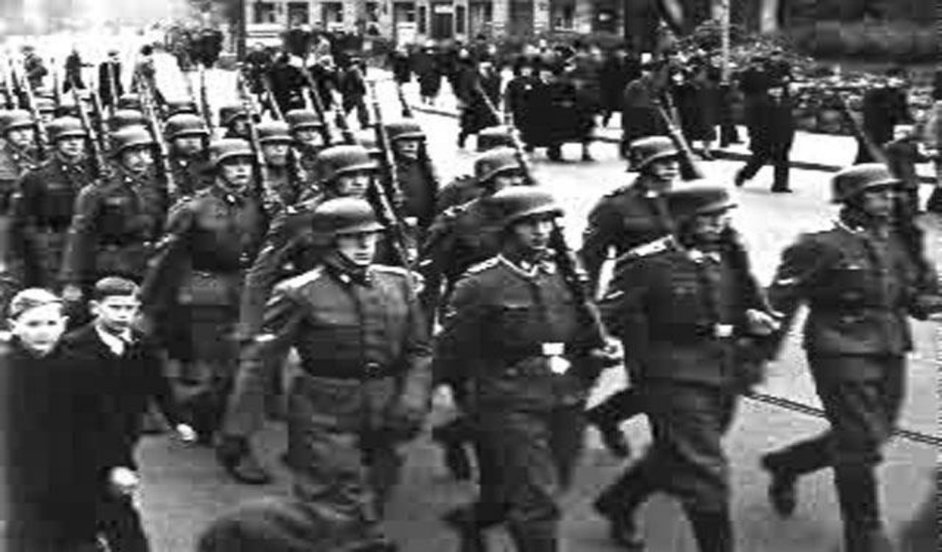
Легион латышских националистов «Латышские стрелки» на параде в Риге.