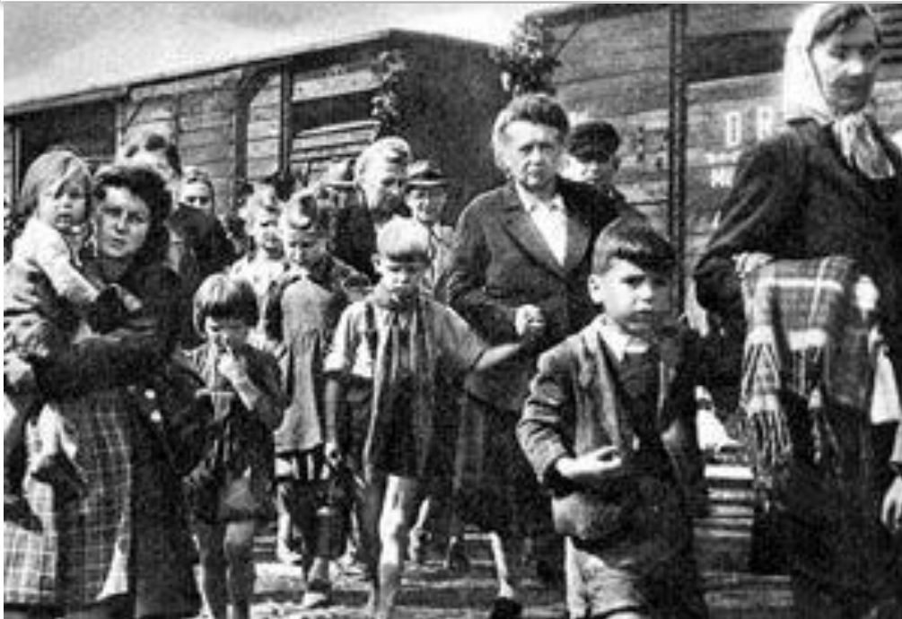
Ожидание депортации. Немцы Поволжья на станции.

Активизация национальных движений привела к ужесточению национальной политики. Летом 1941 г. «диверсантами и шпионами» объявили немцев Поволжья.(1,5 млн. чел.) и выслали в Сибирь и Казахстан. Тогда же по тому же обвинению депортировали в Сибирь 50 тыс. литовцев, латышей, эстонцев. В октябре 1943 г. в Казахстан и Киргизию выселили 70 тыс. карачаевцев, а в Сибирь 93 тыс. калмыков, 40 тыс. балкарцев. Многие снимали прямо с фронта несмотря на посты и звания и также депортировали. 23 февраля 1944 г. на Восток отправили 650 тыс. чеченцев и ингушей, Чечено-Ингушская АССР была упразднена , а в мае 1944 г. в Узбекистан отправили 180 тыс. крымских татар. В результате депортации погибли 144000 человек .