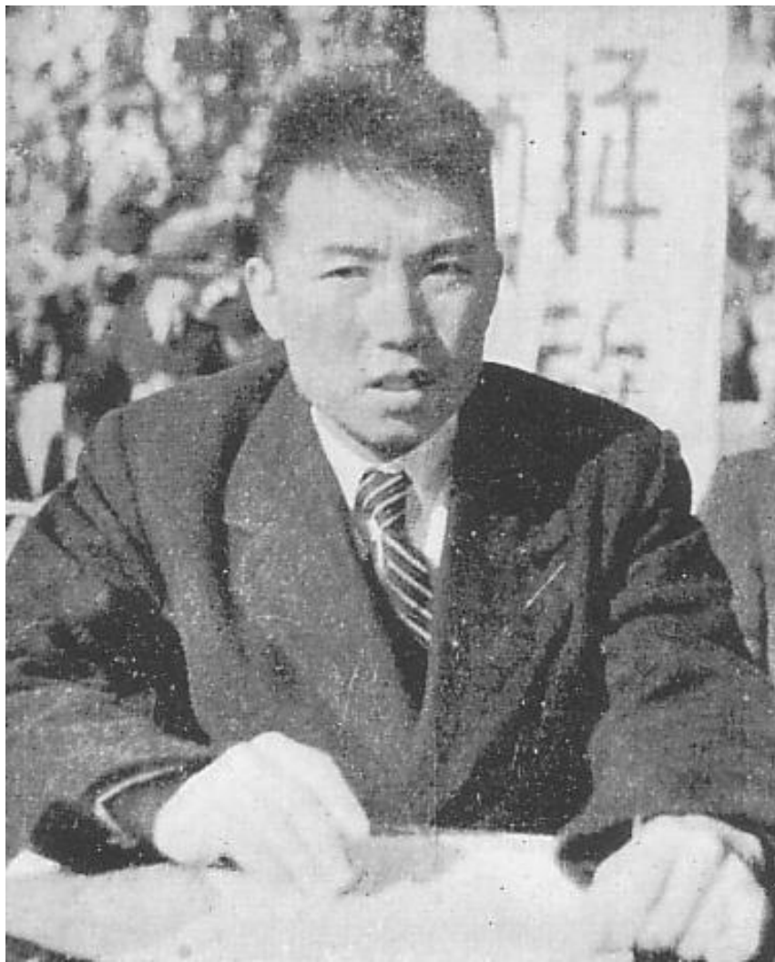
Ким Ир Сен, майор, командир батальона 88-ой отдельной стрелковой бригады. В будущем президент Северной Кореи.