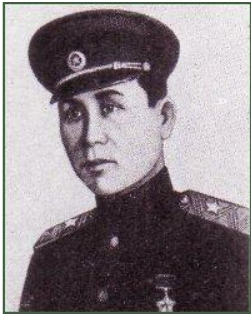
Гвардии генерал-майор, Герой Советского Союза Сабир Рахимов, командующий армией Белорусского фронта.