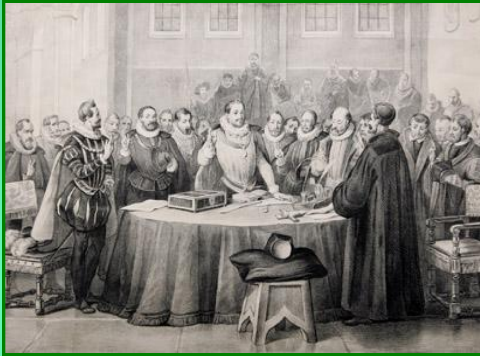
Заключение Утрехтской унии

В 1579 г. семь провинций Северных Нидерландов заключили в Утрехте унию – военно-политический союз против Испании. В 1581 г. Генеральные штаты объявили о низложении Филиппа II, избрав штатгальтером Вильгельма Оранского. Через несколько лет было провозглашено создание Республики Северных провинций (Голландия).