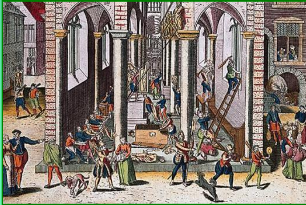
Разгром католической церкви кальвинистами

В 1566 г. по призыву проповедников на севере страны протестанты стали захватывать католические храмы, уничтожать иконы, скульптуры святых, предметы культа. За несколько месяцев иконоборцы разгромили 5,5 тысяч церквей и монастырей. Мятежники создавали вооруженные отряды, освобождали из тюрем кальвинистов, изгоняли католических священников и испанских чиновников, запретили инквизицию.