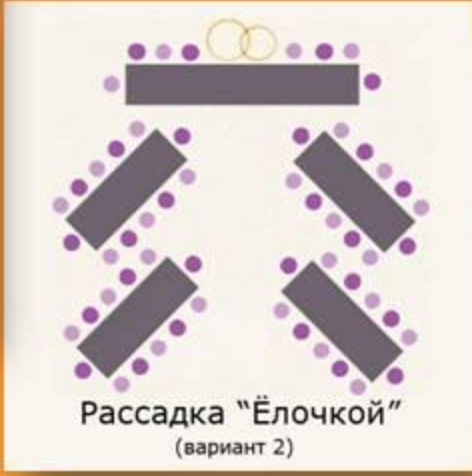
Рассадка "Ёлочкой" (вариант 2)