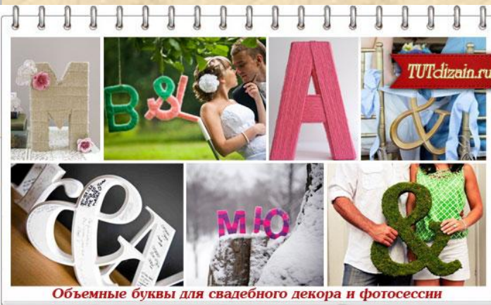
Объемные буквы для свадебного декора и фотосессии