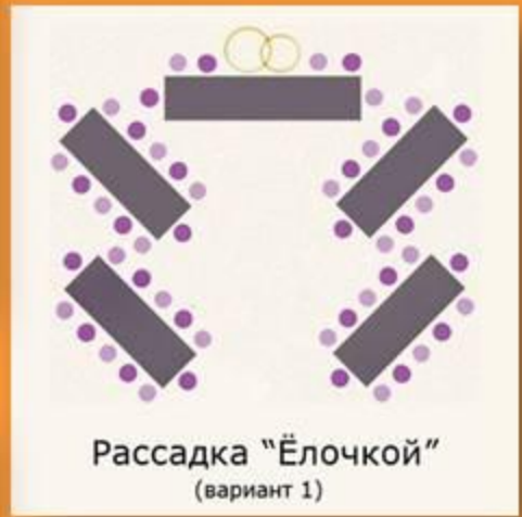
Рассадка "Ёлочкой" (вариант 1)