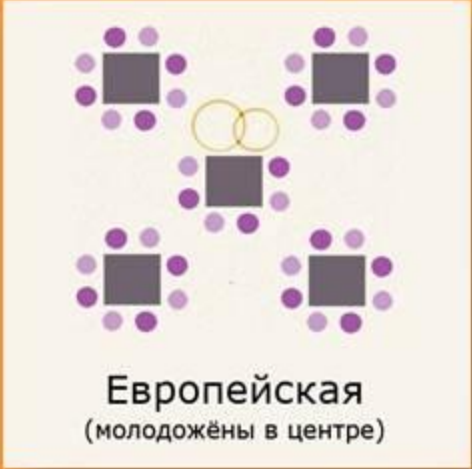
Европейская (молодожёны в центре)