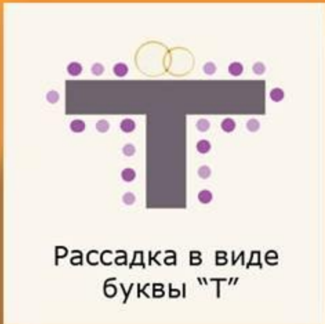
Рассадка в виде буквы "Т"