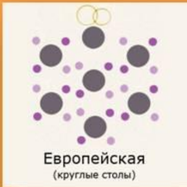
Европейская (круглые столы)