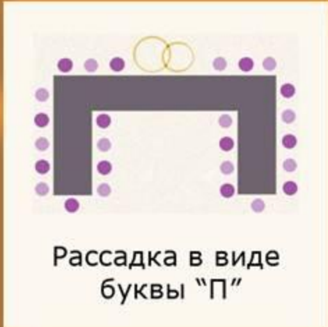
Рассадка в виде буквы "П"