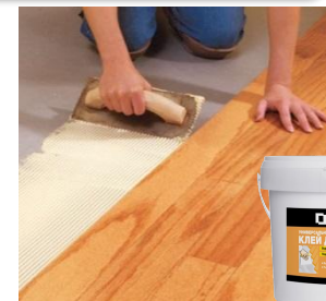
Клей (одно-, двухкомпонентный)