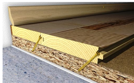
Саморезы 35-45 мм