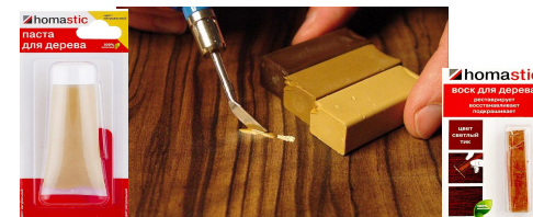
Паста и воск для ремонта