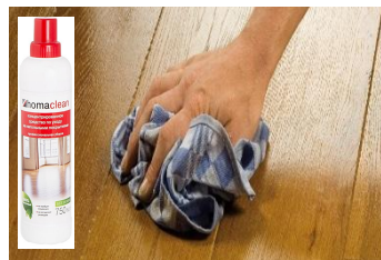
Средства по уходу