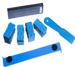
Набор для укладки массива