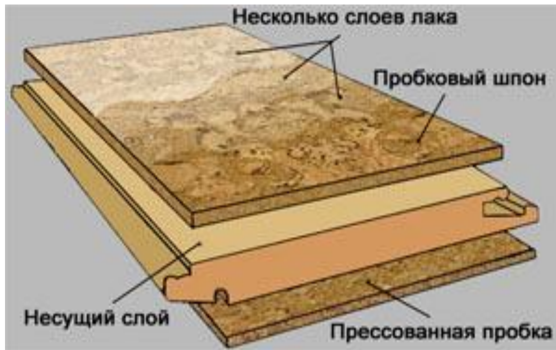
Замковая (пробковый паркет)