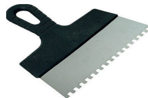
Зубчатый шпатель 2-3 мм