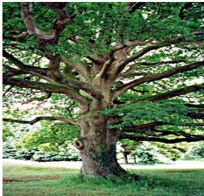
Дуб (различной тонировки)