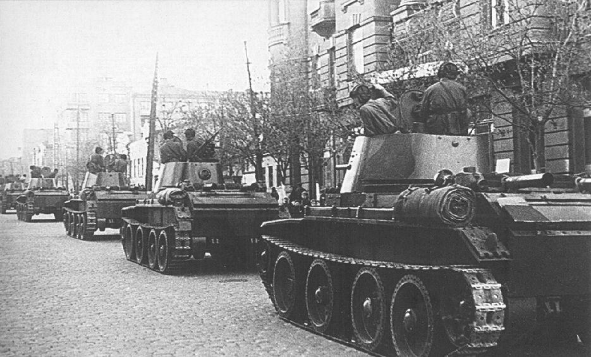
Колонна танков БТ-7 на Будёновском проспекте возле здания Горсовета (бывший дом Чирикова). Апрель или май 1942 года.