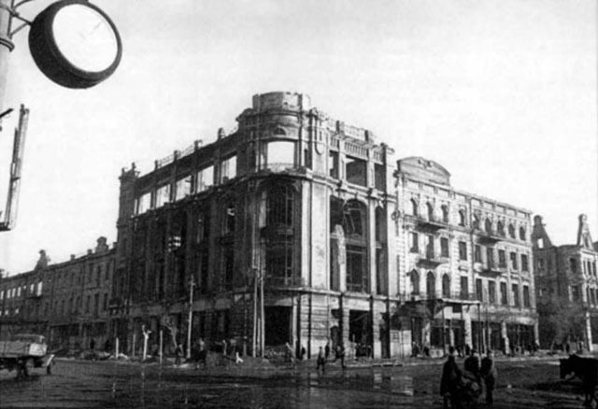
Ростов после освобождения в 1941 году