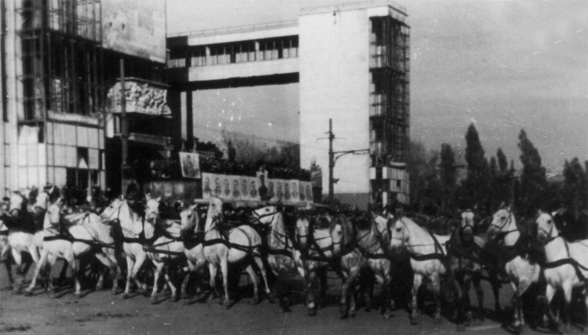
Парад победы в Ростове на Театральной площади 14 октября 1945 года.