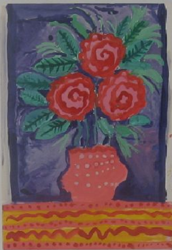
Островская Таис, 6 лет