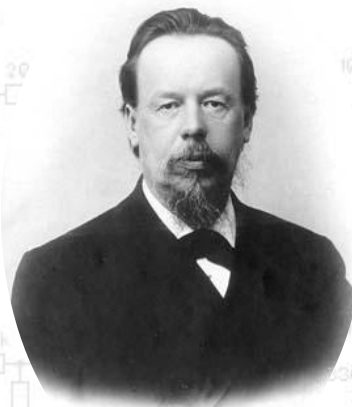
А. С. Попов 1895-1905