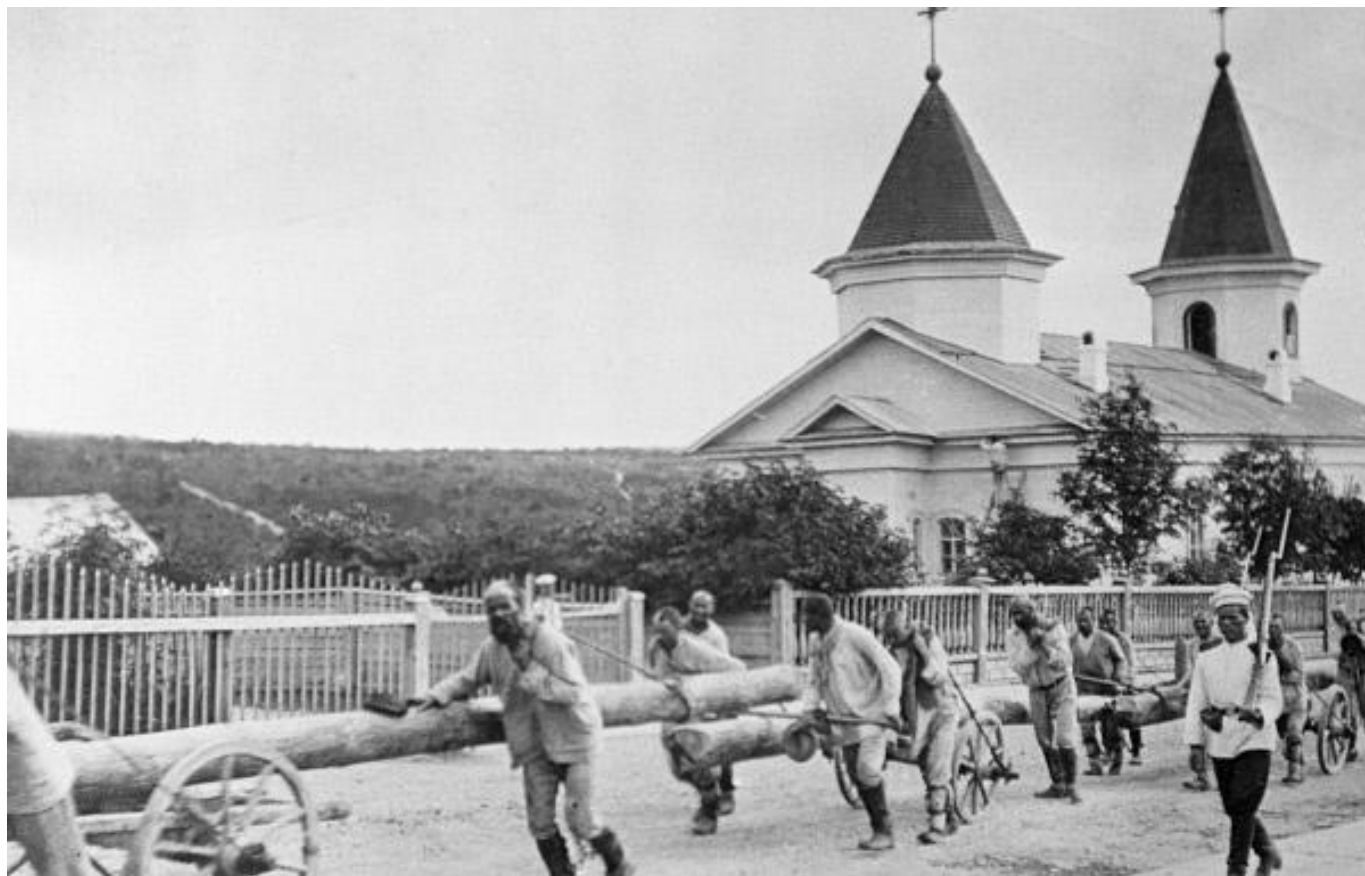
Каторжане перевозят бревна. Фотография привезена Антоном Чеховым из путешествия по Сахалину. 1890 год