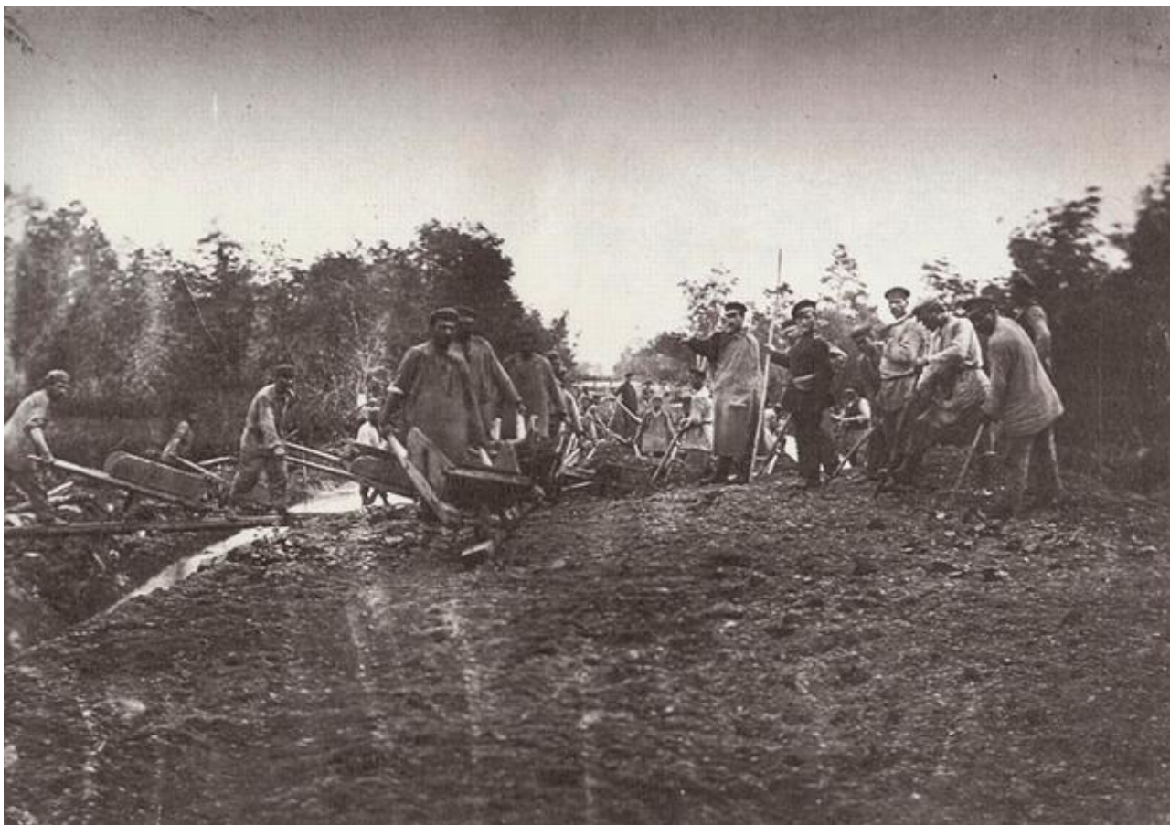
Заклученные за работой. Фотография Иннокентия Павловского, привезена Антоном Чеховым из путешествия по Сахалину. 1890 год