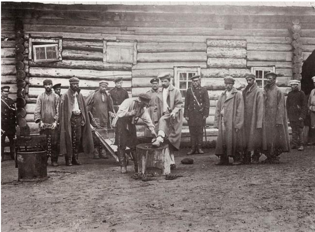
Заковка арестованных в кандалы на острове Сахалин. Привезена Антоном Чеховым из путешествия по Сахалину. 1890 год