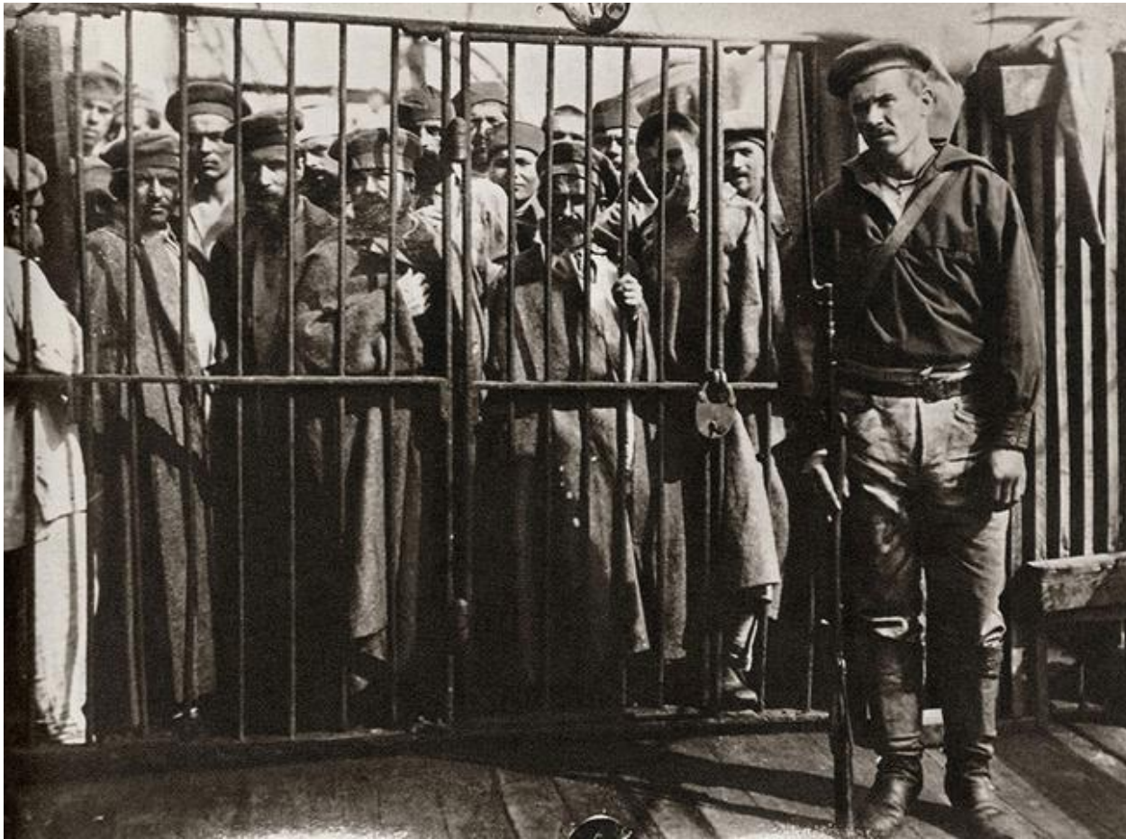
Переправка заключенных на остров Сахалин на пароходе «Петербург». Фотография привезена Антоном Чеховым из путешествия по Сахалину. 1890 год