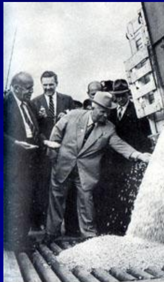
На ферме у Гарста в штате Айова. США. 1959 г.