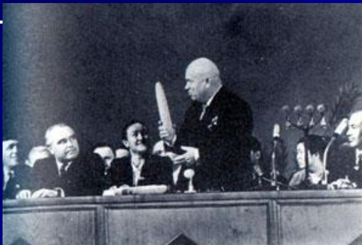
На совещании передовиков сельского хозяйства в Ташкенте. 1961 г.