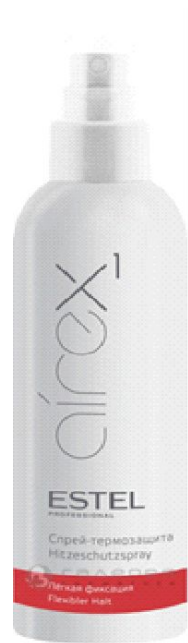
Термозащита для волос