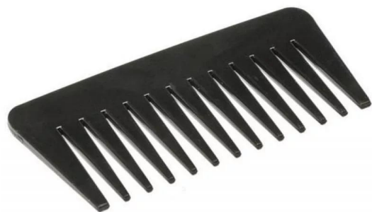
Расческа с редкими зубьями