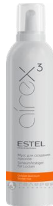
Мусс для волос