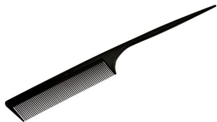
Расческа - «хвостик»