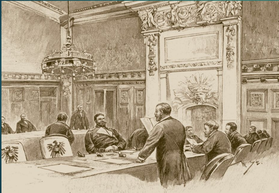
Одно из заседаний бундесрата

Бундесрат - представительный орган земель в составе Германской империи. В него входили представители каждой области Германии.