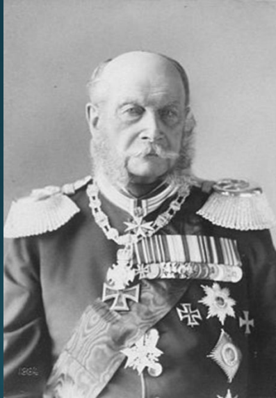
Вильгельм I. Первый Германский император (1871-1888)