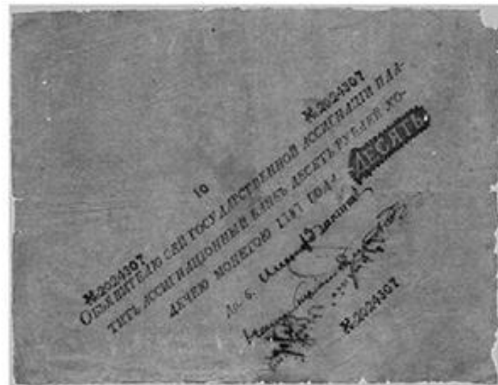
Ассигнация в 10 рублей 1787 г.

Ассигнации имели достоинство 10, 25, 50, 75 и 100 руб., печатались на плотной белой бумаге со сложными водяными знаками и овальными тиснениями. Каждая ассигнация содержала подписи двух сенаторов, советника и директора банка. Разменными к ассигнациям были медные монеты.