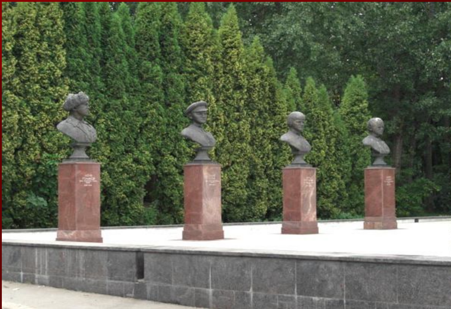
Мемориал пионерам-героям Советского Союза, ВДНХ, Москва