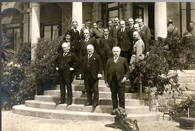
Делегаты Генуэзской конференции, 1922 г.