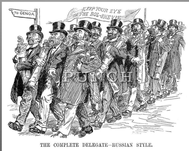
Английская карикатура на представительство большевиков на Генуэзской конференции