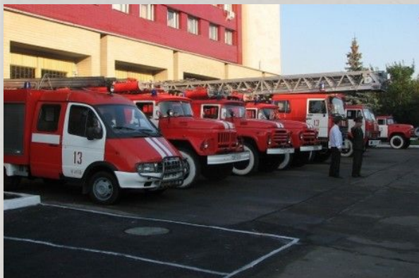
Өрт сөндіру депосы