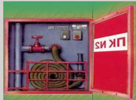
Мекемедегі өрт сөндіретін шүмек