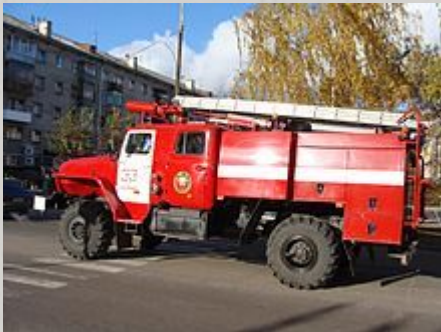
Өрт сөндіру автомобилі