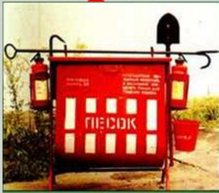
Өртке қарсы қалқан