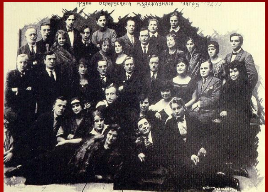
Трупа Беларускага дзяржаўнага тэатра