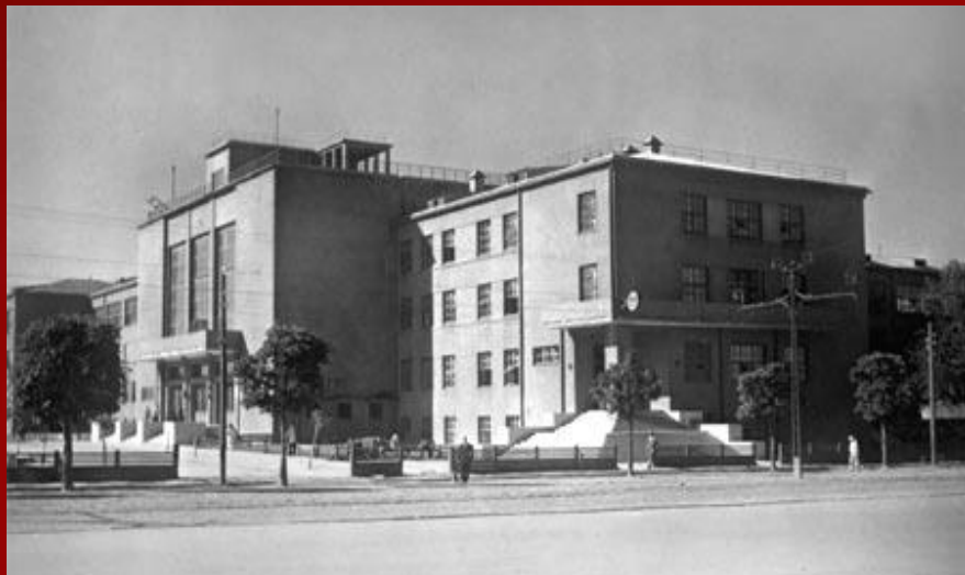
Галоўны корпус БДУ

Пачалася падрыхтоўка спецыялістаў, неабходных для прамысловага развіцця краіны і аднаўлення гаспадаркі, развіццё пачатковай, сярэдняй і вышэйшай адукацыі. У 1921 г. адкрыўся Беларускі дзяржаўны ўніверсітэт (БДУ) , у наступным годзе – сельскагаспадарчая акадэмія ў Горках і ветэрынарны інстытут у Віцебску .