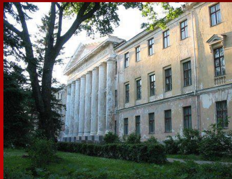
Акадэмія ў Горках

Ствараліся рабочыя факультэты (рабфакі) для падрыхтоўкі рабоча-сялянскай моладзі да паступлення ў вышэйшыя навучальныя ўстановы.