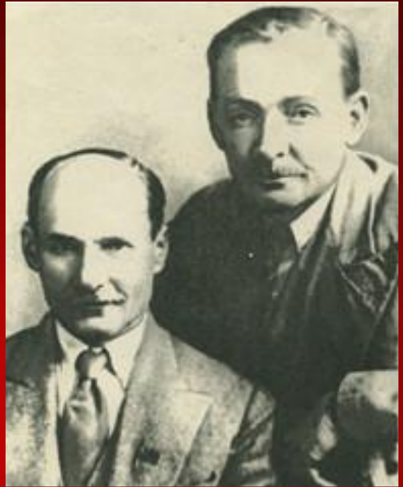
Я.Колас і Я.Купала

Значныя поспехі былі дасягнуты ў развіцці беларускай літаратуры. У 20-я гг. былі апублікаваны паэмы “ Новая зямля ” і “ Сымон-музыка ”, у якіх Я.Колас адлюстравалі жыццё, працу і духоўны свет простых людзей дарэвалюцыйнай Беларусі. Выйшла другая частка трылогіі Я. Коласа “На ростанях” – аповесць “ У глыбі Палесся ”. Менавіта ў гэты перыяд урад БССР прысвоіў Я.Купалу і Я.Коласу ганаровыя званні народных паэтаў Беларусі.