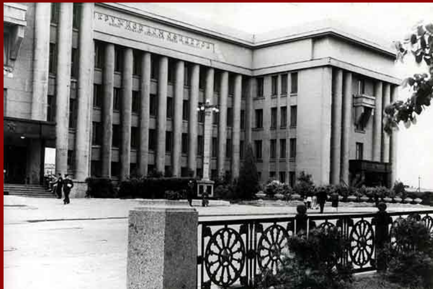
Дом Чырвонай Арміі

Развіццё архітэктуры значна змяніла знешняе аблічча гарадоў. Па праектах архітэктара І.Лангбарда і яз яго удзелам у Мінску былі пабудаваны Дом урада, Дом Чырвонай Арміі, галоўны корпус Акадэміі навук, Дом Саветаў у Магілёве. Ва ўнутраным афармленні Дома ўрада прымалі ўдзел скульптары З.Азгур, А. Бембель.