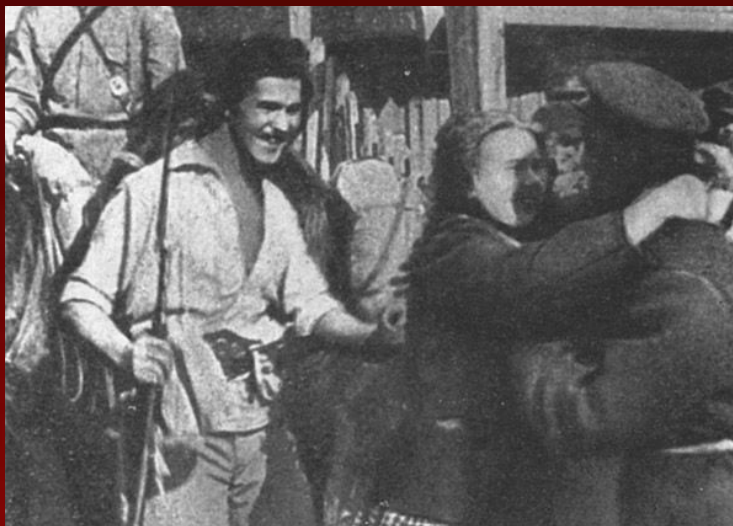
Кадр з фільма “Лясная была”

У гады беларусізацыі адбывалася станаўленне беларускага савецкага кіно. У 1926 г. па матывах аповесці М.Чарота “Свінапас” быў створаны першы беларускі мастацкі героіка-патрыятычны фільм аб грамадзянскай вайне “ Лясная была ”.