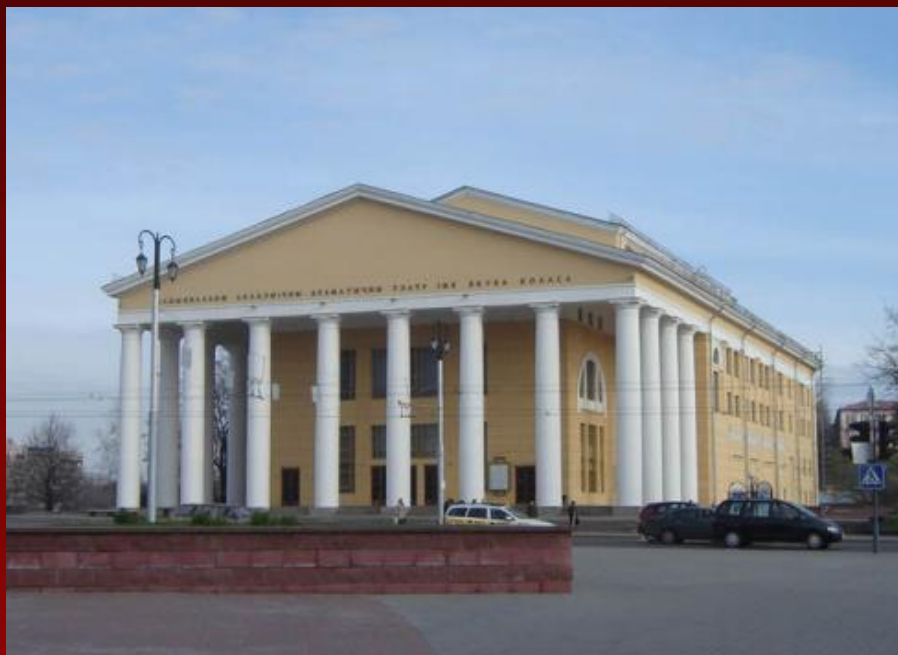
Тэатр імя Я.Коласа

У Віцебску дзейнічаў БДТ-2 (цяпер Нацыянальны акадэмічны драматычны тэатр імя Я.Коласа). У той час там працавала выдатная актрыса С.Станюта.