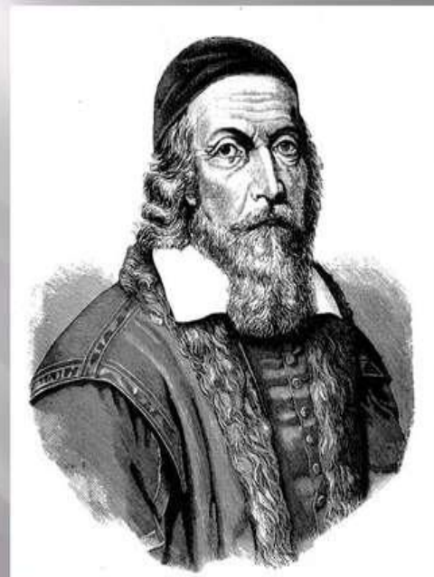
Ян Амос Коменский (1592-1670)

Педагогика тарихында Коменский — ең белгілі, аты әлемге танымал ірі тұлғалардың бірі. Өз дәуірінің алдыңғы қатарлы іліміне сүйене отырып, демократиялық сипаттағы және бұқара халықтың ағарту ісіне ұмтылысын бейнелейтін педагогикалық жүйені жасады. Коменский жалпыға бірдей оқыту, бірыңғай мектеп жүйесі, ана тіліндегі мектеп, жеңіл де және түсінікті оқыту үшін күресті. Балаларды ерте жас кезінен бастап, мүмкіншілігі келетін еңбекке баулу қажеттігін атап көрсетті. Коменский - өте күрделі, қарама-қайшылықты тұлға. Ол тәрбиенің мақсаттары туралы, оқытудың мазмұны туралы мәселелерде ортағасырлық діни көзқарасқа бой ұрды. Бірақ оның жүйесі тұтас алғанда прогрессивтік сипатқа ие болып табылады. Негізгі педагогикалық мәселелерді алдыңғы қатарлы, ал кейде тіпті өз дәуірінің материалистік теориясының және мектебінің озық тәжірибесі рухында шеше білді.