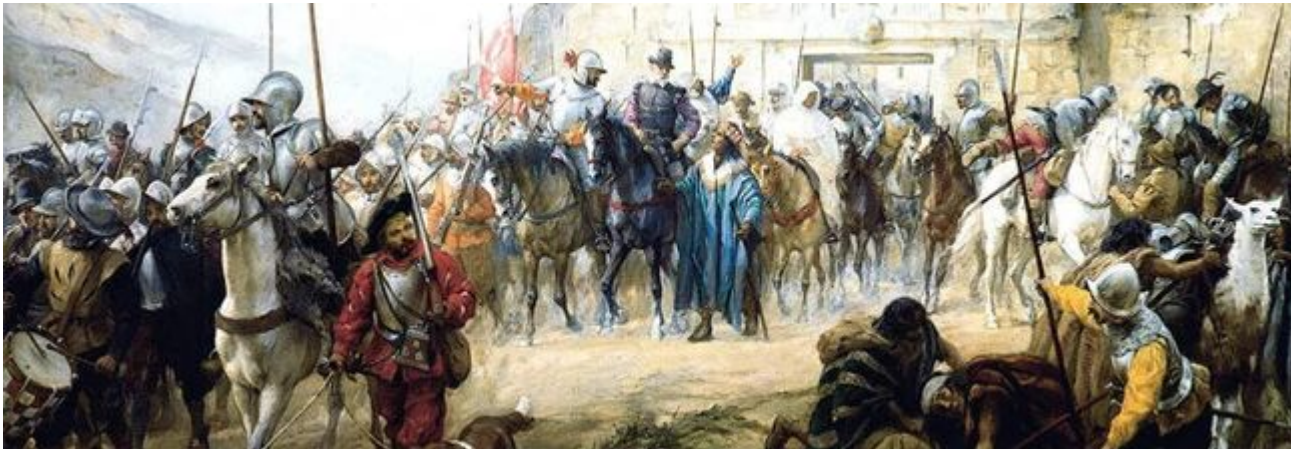
Испанская армия в Андах

К 1550 году испанскими конкистадорами было завоевано Чили, где возник город Сантьяго. Испанцы не нашли здесь богатых залежей драгоценных металлов, как в Перу, и колонизация приняла сельскохозяйственный характер, с наплывом в XVII веке переселенцев из беднейших испанских провинций, а также басков.