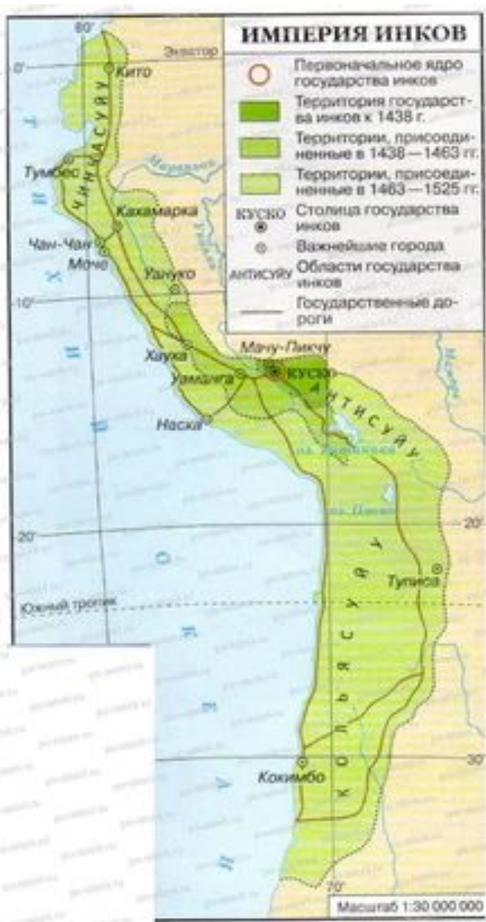
Карта империи инков