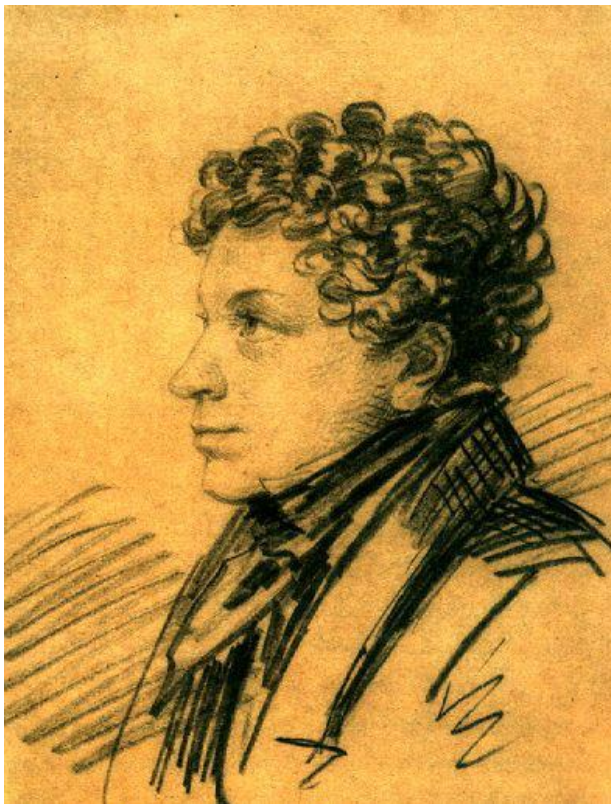
Брат, Лев Сергеевич Пушкин (1805-1852г.)