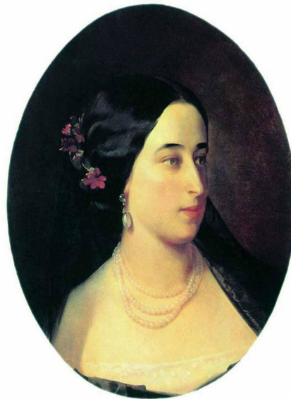
Младшая дочь, Наталья Александровна Пушкина (1836-1913 г.)