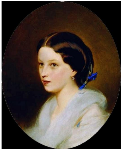
Старшая дочь Мария Александровна на Пушкина (1832-1919г.)