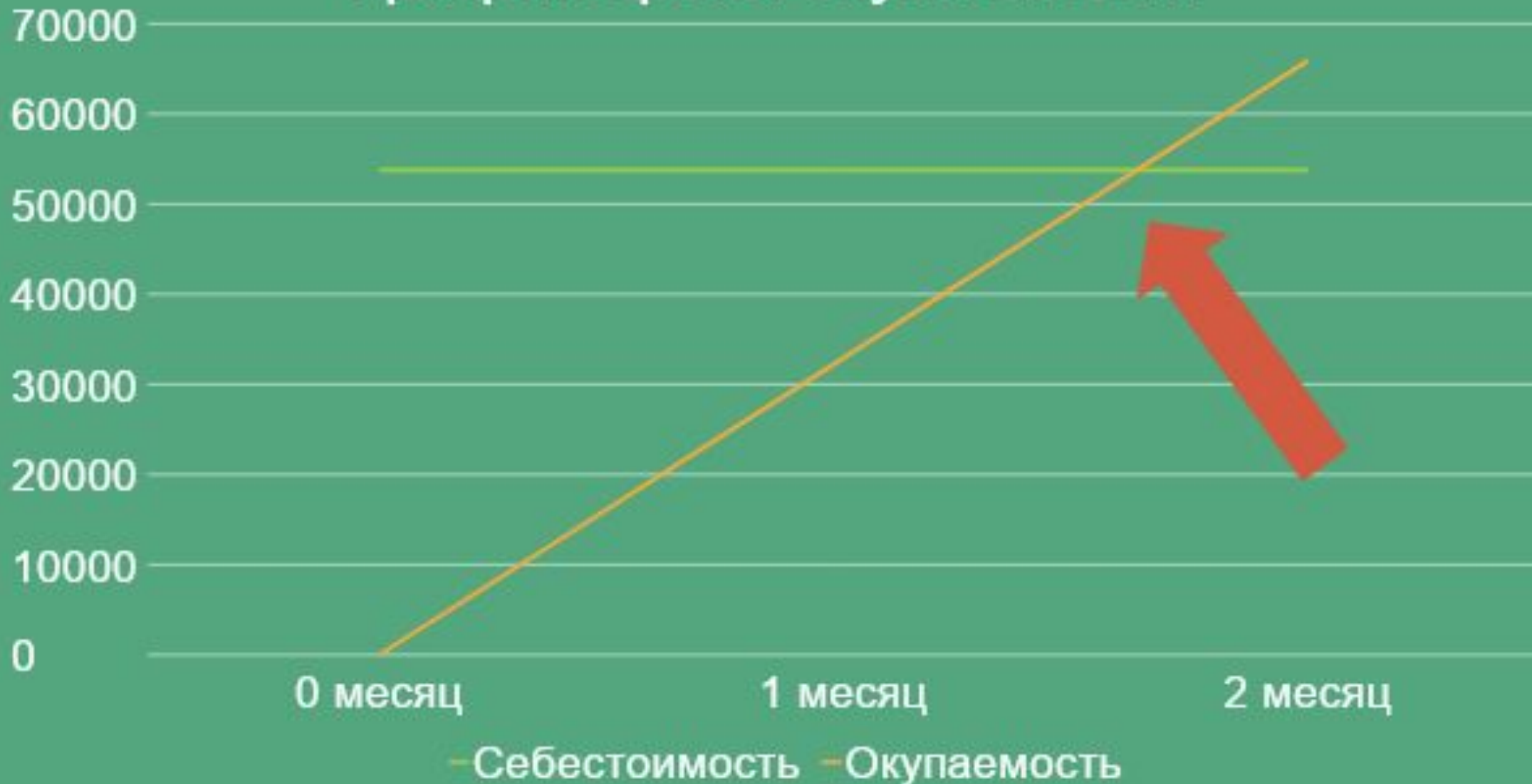
График срока окупаемости