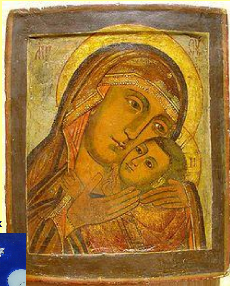
Корсунська (Ефеська) Чудотворна ікона Богородиці