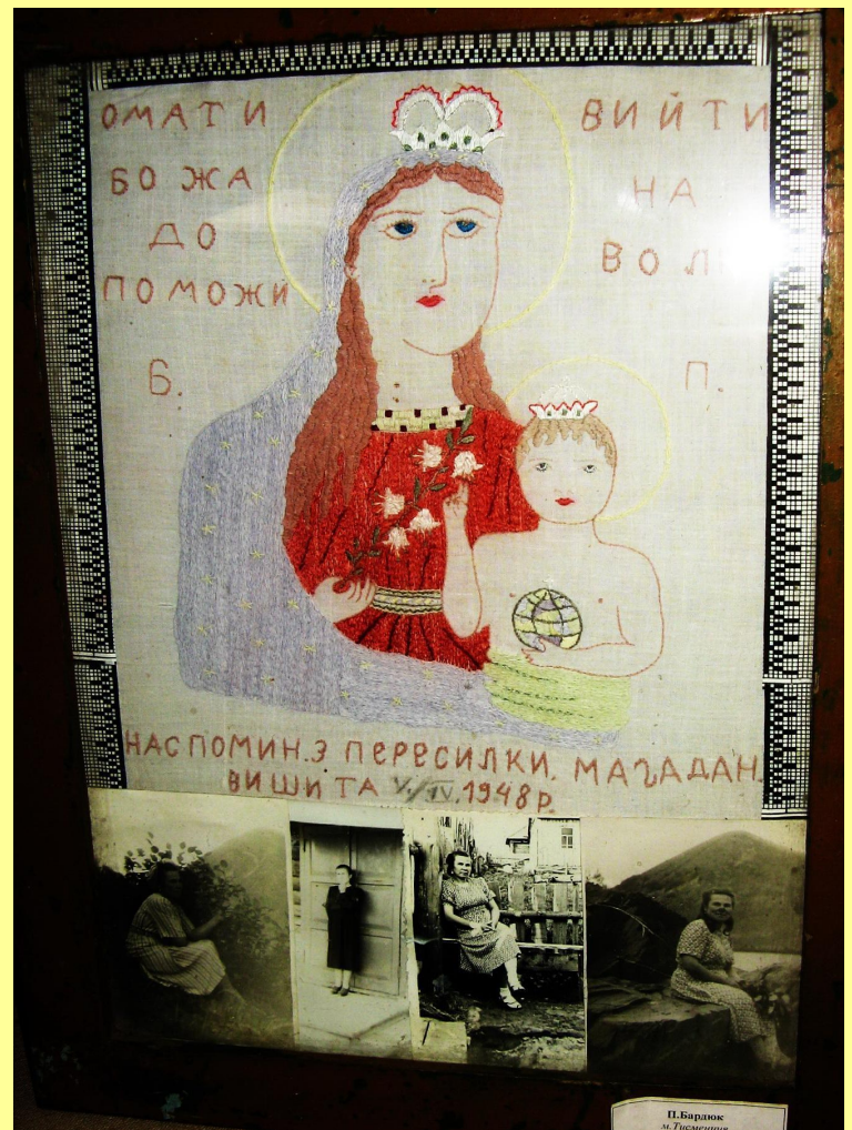
Вишита ікона «О, Мати Божа допоможи вийти на волю». П. Бардюк. 1948 р. Напис, вишитий на іконі: «На спомин з пересилки. Магадан. Вишита V / IV. 1948 р. Музей історії м.Тисмениці