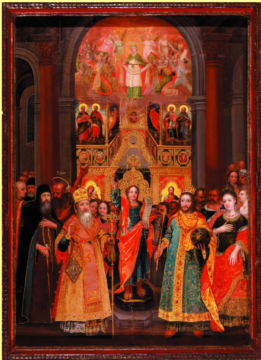
«Покров Богородиці». Перша пол. XVIII ст. С. Сулимівка (тепер Богуславського р-ну Київської обл.).