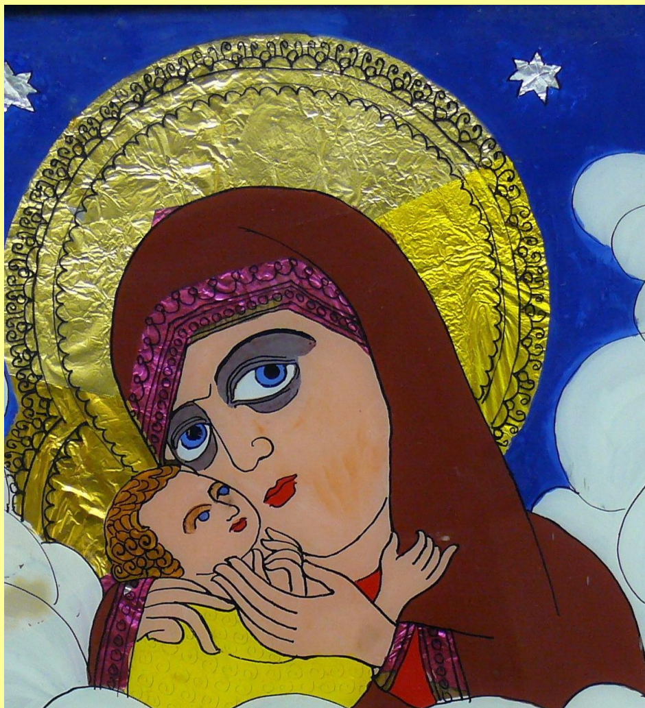
Образ Богородиці з Дитям на іконі з Милорадового