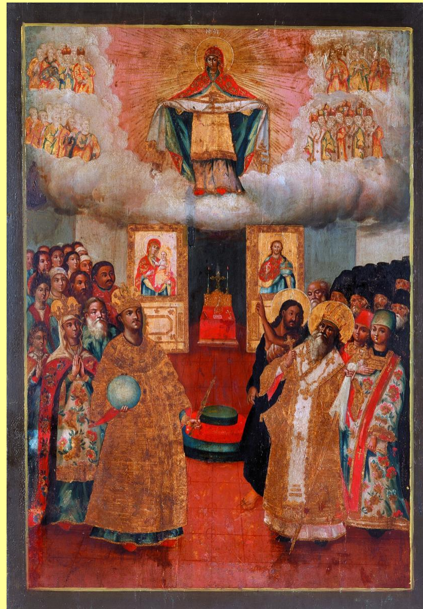
«Покров Богородиці». 5 XVIII ст. М. Миргород (?) Полтавської обл.