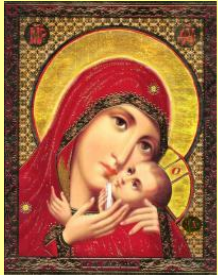
Касперівська Чудотворна ікона Богородиці