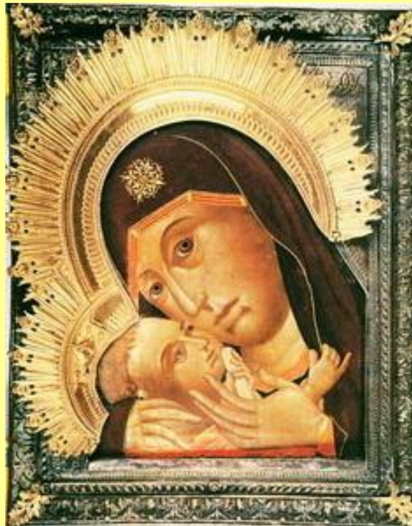
Касперівська Чудотворна ікона Богородиці