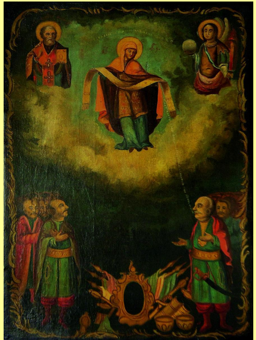
Копія 1905 р. з січової ікони «Покров Пресвятої Богородиці» 1770-х рр. Дніпропетровський національний історичний музей ім. Д. І. Яворницького