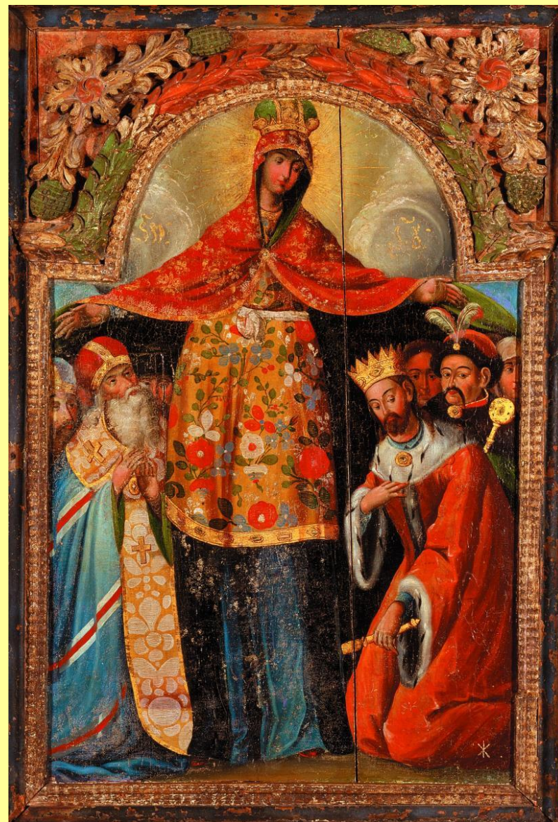
«Покров Богородиці». Перша пол. XVIII ст. С. Дешки 4 (тепер Богуславського р-ну Київської обл.).