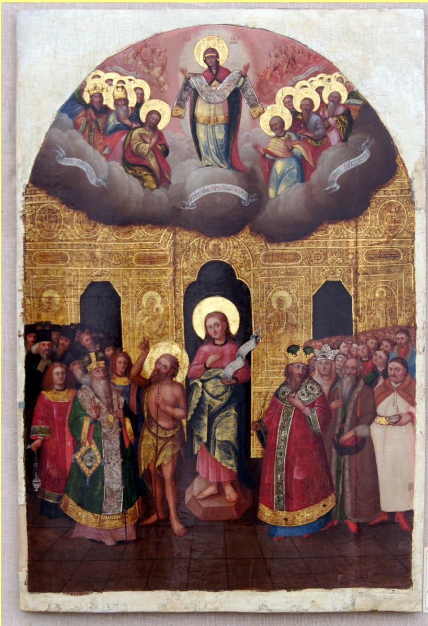
«Покров Богородиці». Перша пол. XVIII ст. М. Новгород- Сіверський Чернігівської обл.