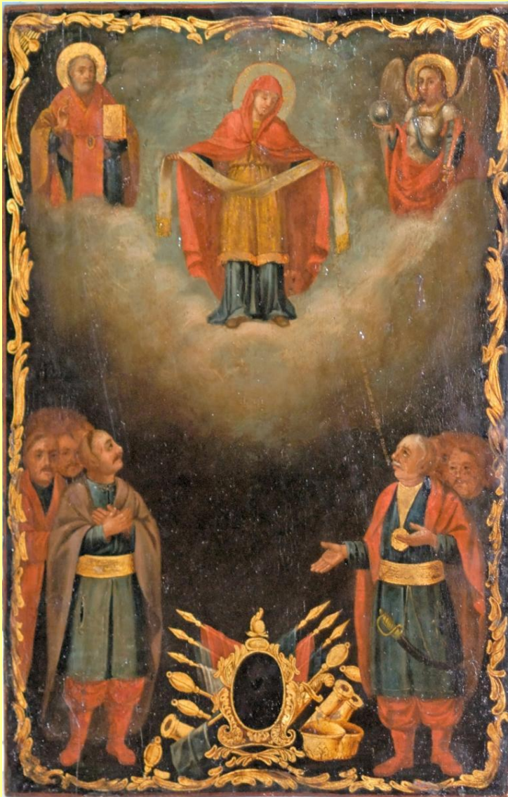
Копія 1836 р. з січової ікони «Покров Богородиці». Одеський історико-краєзнавчий музей