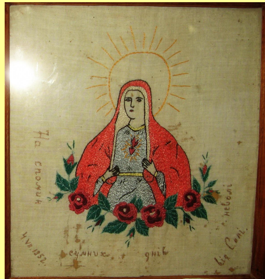
Вишита ікона «Непорочне Серце Марії». 1952 р. Напис, вишитий на іконі: «На спомин сумних днів неволі. 4.VII.1952. Музей історії м. Тисмениці