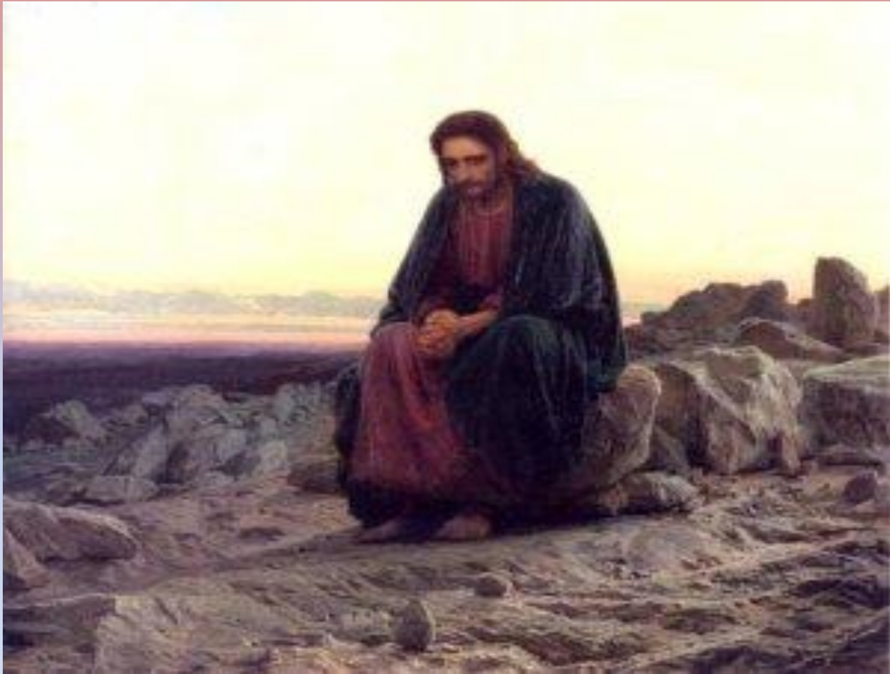
Христос в пустыне. (1872)