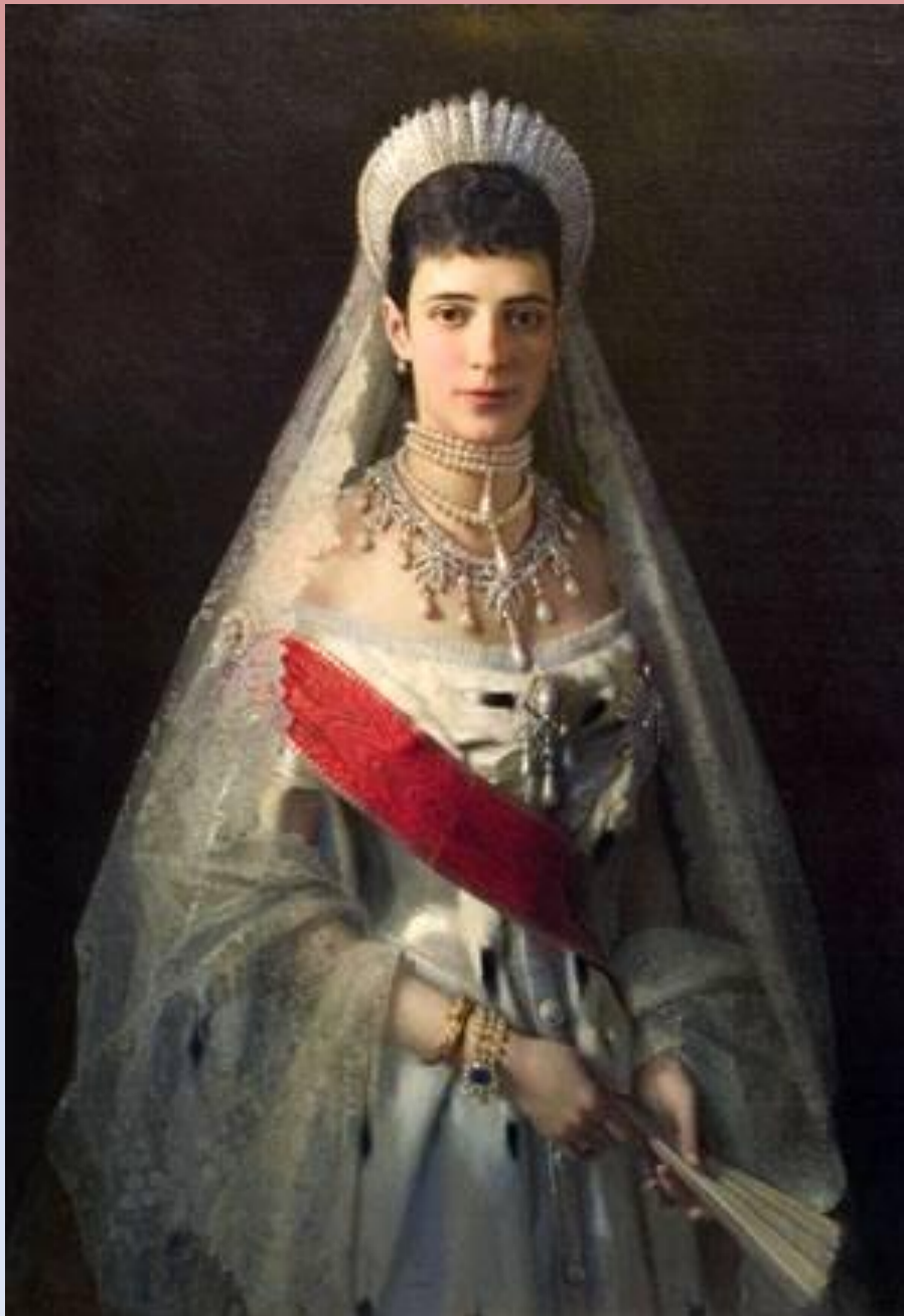
Портрет императрицы Марии Федоровны