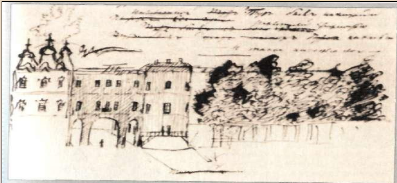
Лицей. Рисунок А.С.Пушкина

19 октября 1811 года. Торжество открытия Царскосельского лицея. В Актовом зале собралась царская семья с государем, высокопоставленные чиновники и гости, преподаватели и гувернеры, тридцать воспитанников и среди них Пушкин. Были прочитаны манифест об учреждении Лицея и Устав, в котором было записано, что в этом учебном заведении телесные наказания запрещены.