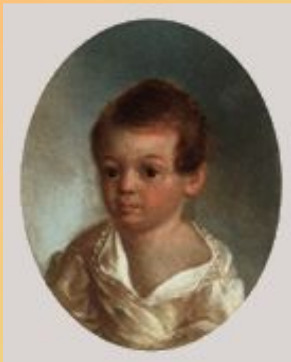
К. де Местр(?). Пушкин-ребенок. Метал. пласт., масло. 1801-1802. (ГМТ)

Детские годы Пушкина протекли в Москве и подмосковном селе Захарове.