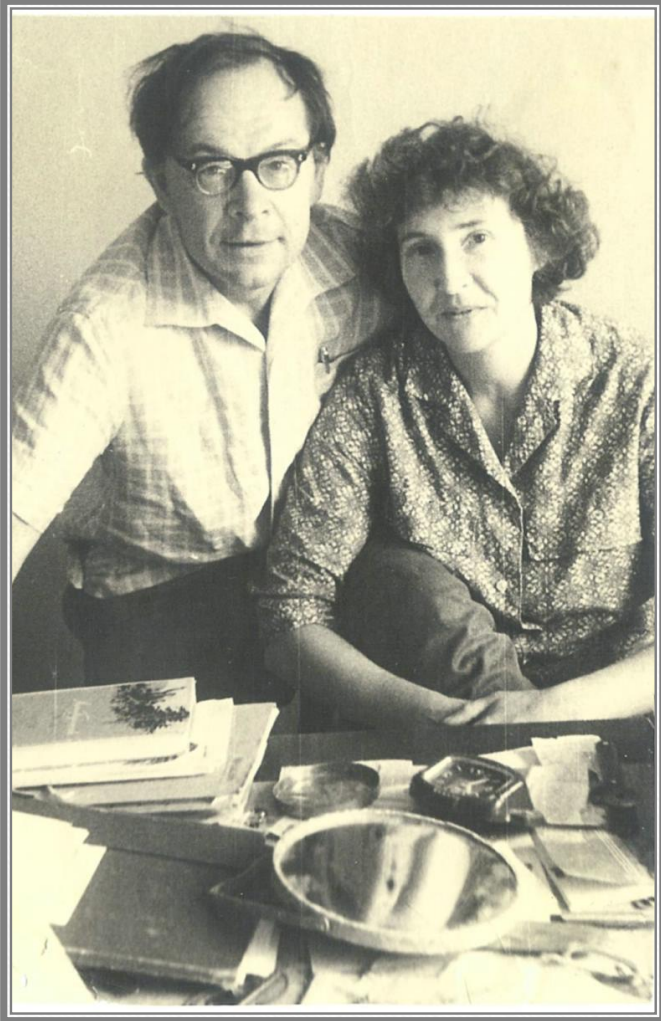
Дудинцев с женой