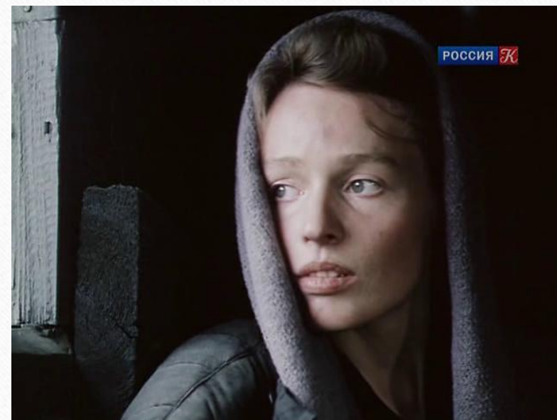
Кадр из киноадаптации «Белые одежды»

По его широко известным произведениям сняты кинофильмы. Широкую известность получает только с началом "перестройки" в стране. Печатаются его работы, и его имя становится в ряд с другими известными представителями современной литературы. Труд Владимира Дудинцева отмечен Государственной премией СССР в 1988 году.