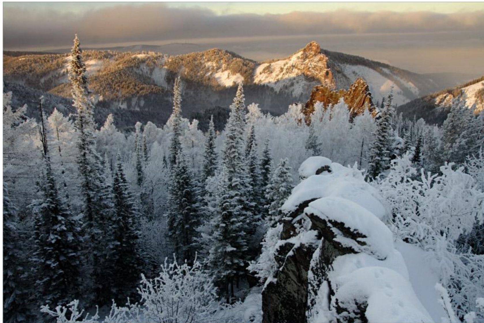
Большой Арктический қорық

Қорықтардың бірі - Командорский. Оның аумағы - Убунгада орналасқан.