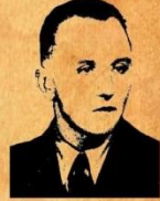
Генерал-хорунжий Василь Кук «Леміш»