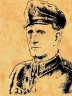
Генерал-хорунжий Роман Шухевич «Тарас Чупринка»