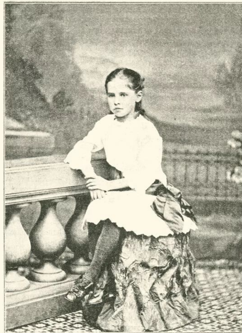
Героиня повести «За что» — на седьмом году жизни.

Была очень впечатлительной, откровенной и открытой натурой.