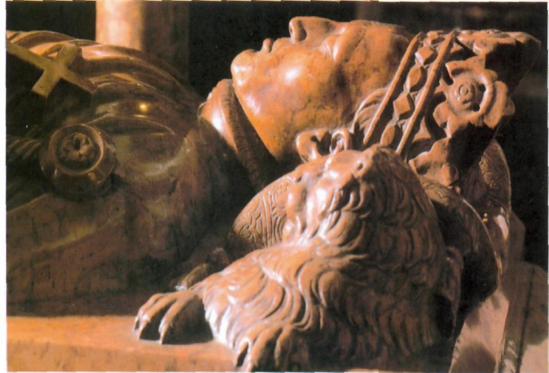
▲ Надгробок короля Владислава-Ягайла у Вавельському кафедральному соборі. Краків