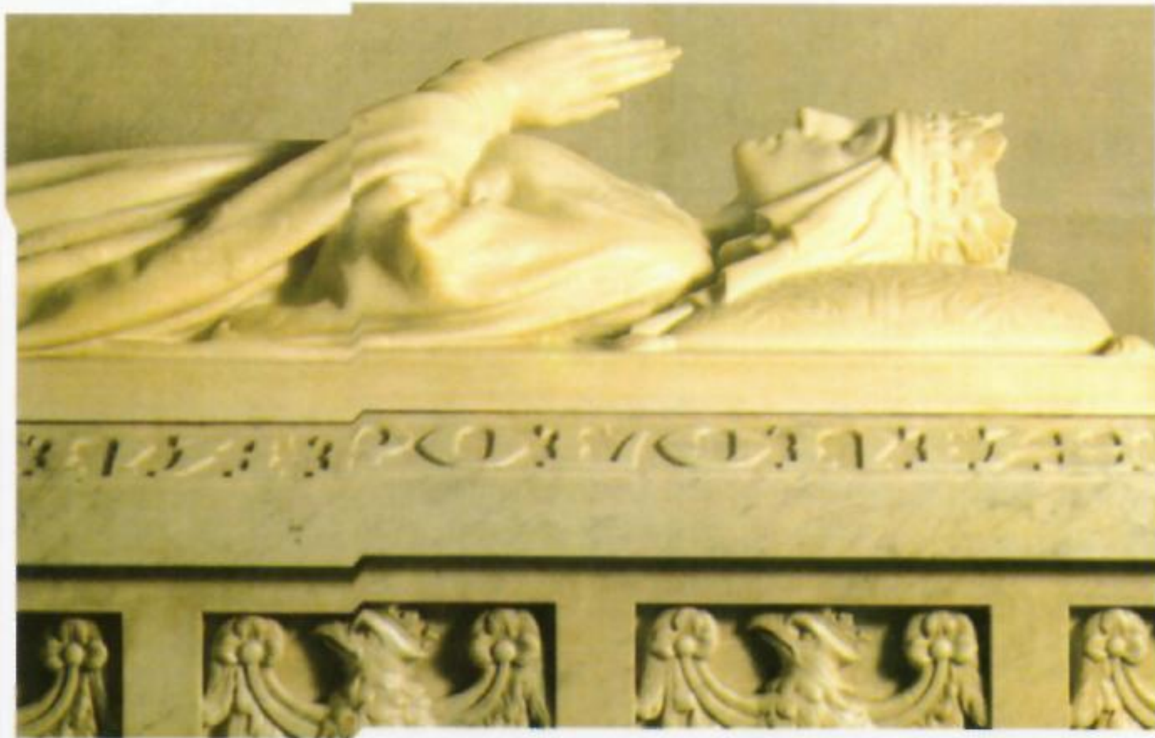
▲ Надгробок королеви Ядвіги. Кафедральний собор на Вавелю. Краків