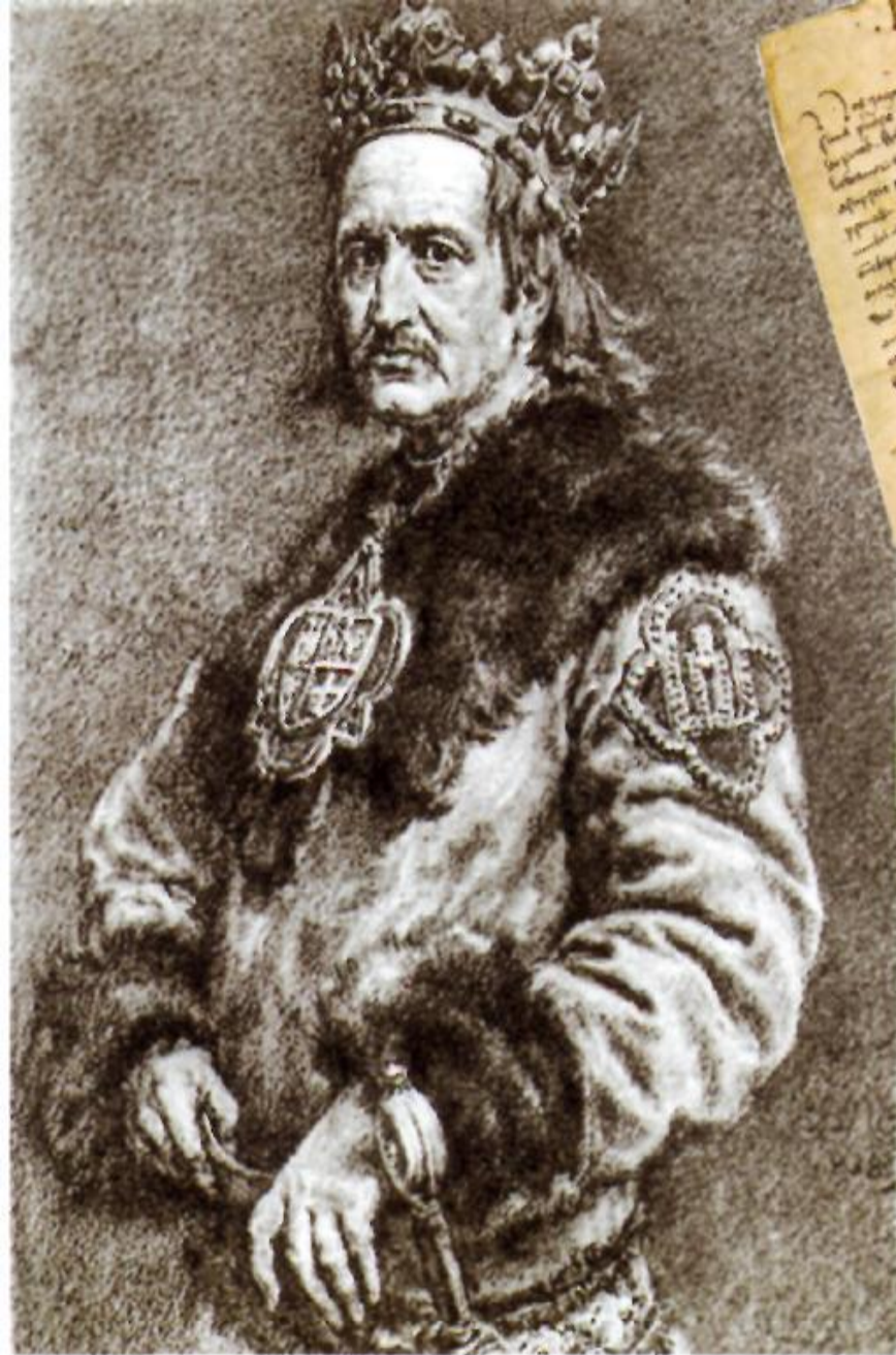
▲ Владислав-Ягайло. Малюнок Яна Матейка