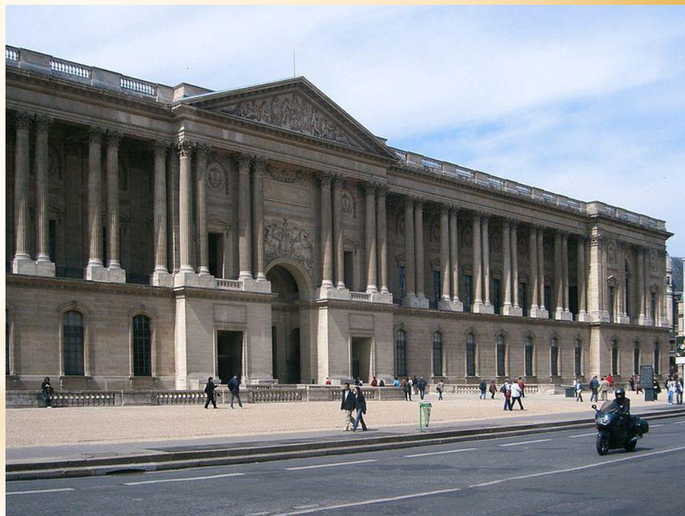
Колоннада Луврского дворца

Оформлением и украшением дворца руководили тогда такие художники как Пуссен, Романелли и Лебрен. В 1667—1670 гг. архитектором Клодом Перро на восточном фасаде дворца, выходящем на площадь Лувра, сооружена Колоннада Лувра.