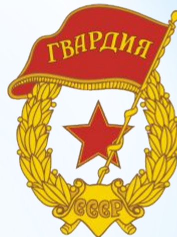
Геральдический знак гвардии СССР.

Гвардия (итал. Guardia -охрана, защита)-в настоящий момент-отборная, привилегированная часть войск, отборные воинские части.