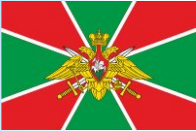
Пограничная Служба ФСБ России