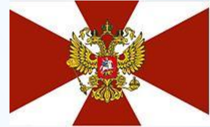
Внутренние войска МВД РФ