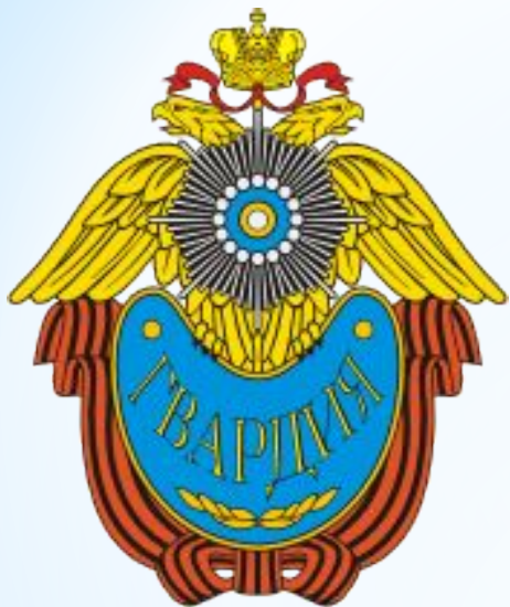
Современный геральдический знак гвардии ("Гвардия") России.