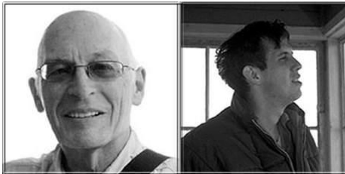
Том ван Влек

Электронды поштаның пайда болуын 1965ж жатқызуа болады. Осы жылы Массачусетк – технологиялық институтының (MIT) қызметкерлері Ноэль Моррис және То Ван Влек, CTSS (Compatible time-sharing system) операциялық жүйесіне арналған MAIL бағдарламасын жазды. Ал бұл бағдарлама IBM 7090/7094 компьютерінде орнатылды.