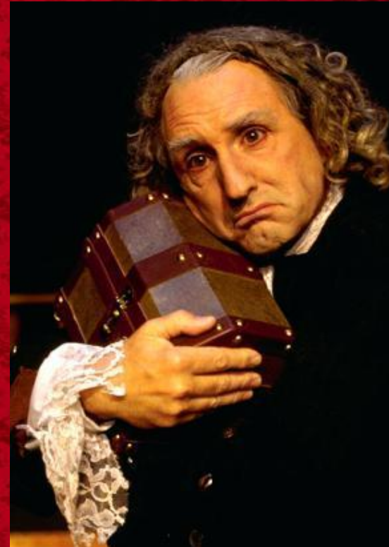
“The Miser” Shakespeare Theatre Company, Washington