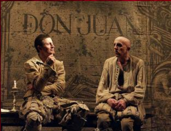
Kyiv Young Theatre, 1997

В основу пьесы Мольер положил испанскую легенду о Дон Жуане — неотразимом обольстителе женщин, попирающем законы божеские и человеческие. Образ Дон Жуана Мольер наделил бытовыми чертами французского аристократа XVII века — титулованного развратника, беспринципного, лицемерного, наглого и циничного.