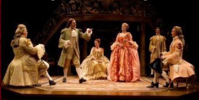
The Misanthrope at the Stratford Shakespeare Festival August 2011