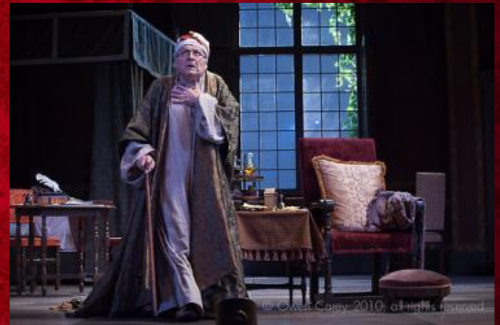
The Imaginary Invalid Portland Center Stage

Арган, воображающий себя больным, является игрушкой в руках недобросовестных и невежественных врачей. Мольер нападает на шарлатанов-врачей так же, как он напал на прочих лжеучёных.