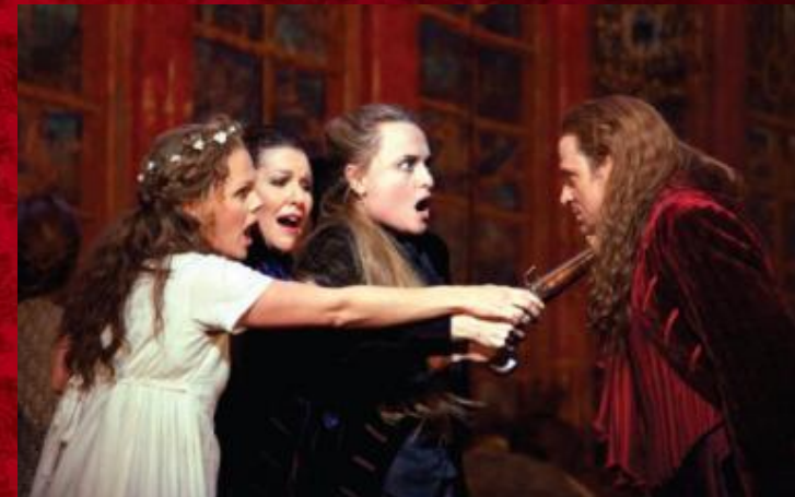
Фильм-опера «Дон Жуан»