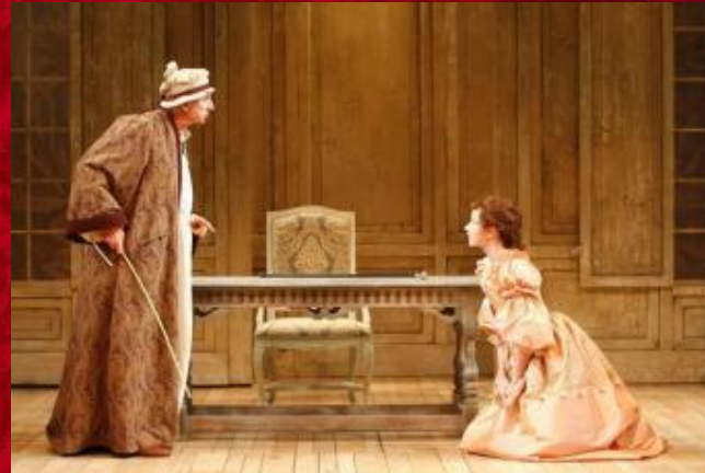
The Imaginary Invalid Shakespeare Theatre Company, Washington