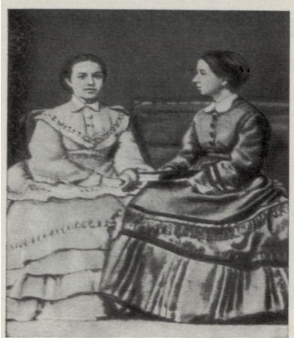
С. В. Ковалевская и Ю. В. Лермонтова.

Женщина-профессор и первая в мире женщина- профессор математики