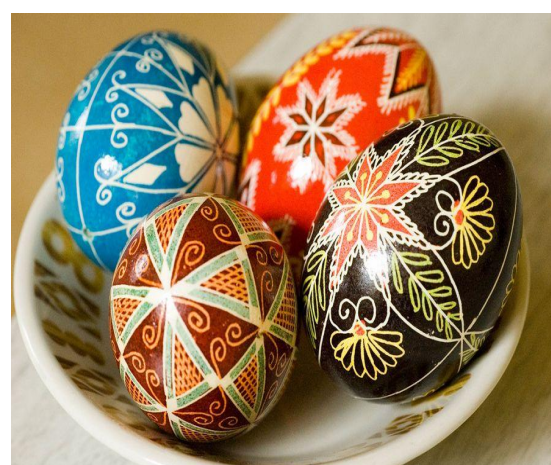
Яйца, на которых рисуют различные рисунки « писанки ».