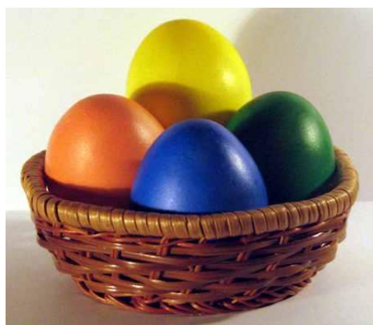
Яйца разукрашиваются разными цветами « крашенки »

Яйцо в контексте Пасхи занимает особое место. На праздник к римскому императору Тиберию пришла Мария Магдалина с благой вестью: «Христос воскрес!» - сообщила она и преподнесла в дар куриное яйцо. Император ответил, что скорее яйцо станет красным, чем он поверит в эту новость. И тут, на глазах у изумленной публики, белое куриное яйцо в руках Марии Магдалины стало красным! Когда император это увидел, он был поражен и ответил: «Воистину воскрес!» Отсюда и пошла традиция перед Пасхой окрашивать яйца — как символ торжества правды над ложью, жизни над смертью .