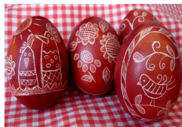
яйцо покрывается воском, красится, а затем на нем иголкой выцарапывают различные узоры, « драпанки »