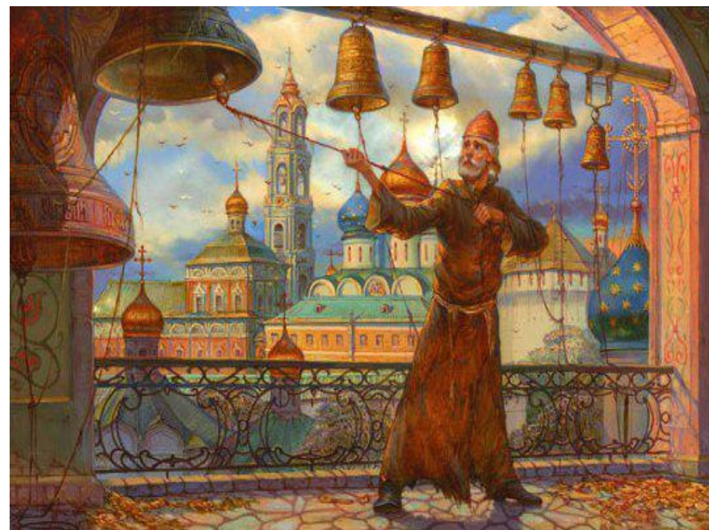
Колокольный звон .