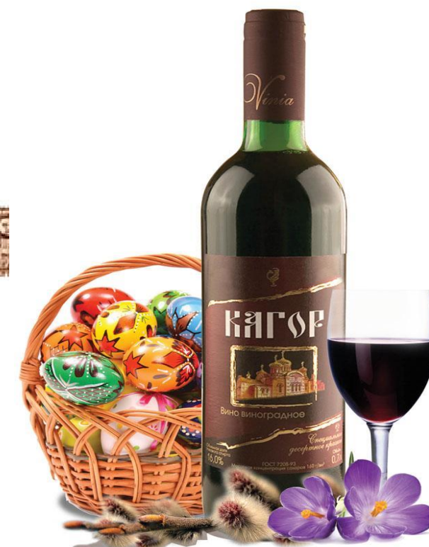
Пасхальное вино- Кагор