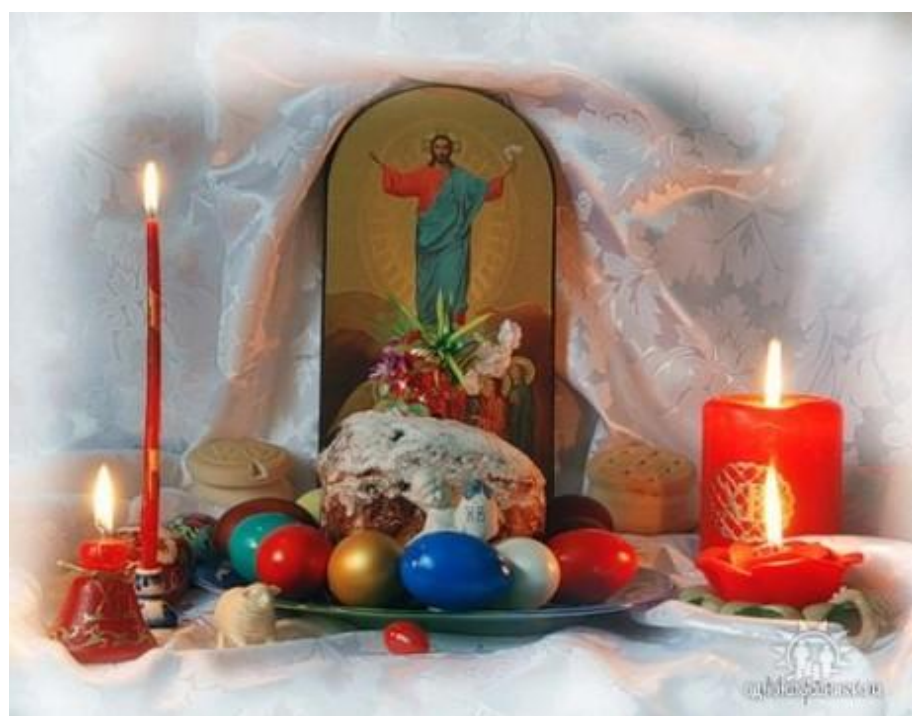
Свечи, куличи и крашеные яйца