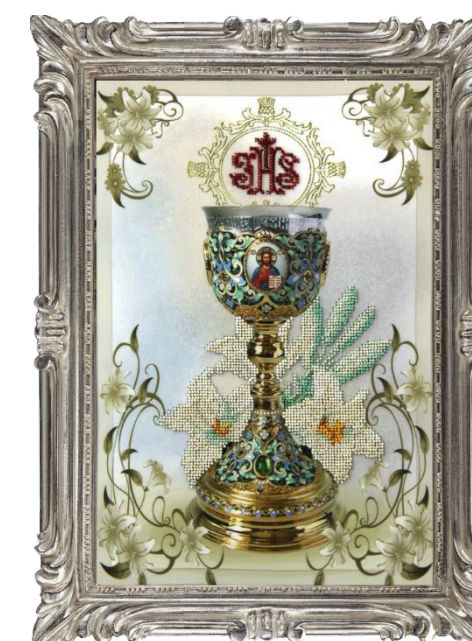
Пасхальная чаша и ключевая вода