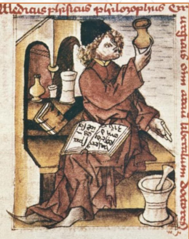
Средневековый врач с уринарием в руках

Чаще средневековые врачи использовали в качестве эмблемы изображение уринария (сосуда для мочи). Исследование мочи на глаз — так называемая уроскопия — являлось одним из древнейших способов диагностики в медицине всех народов мира.